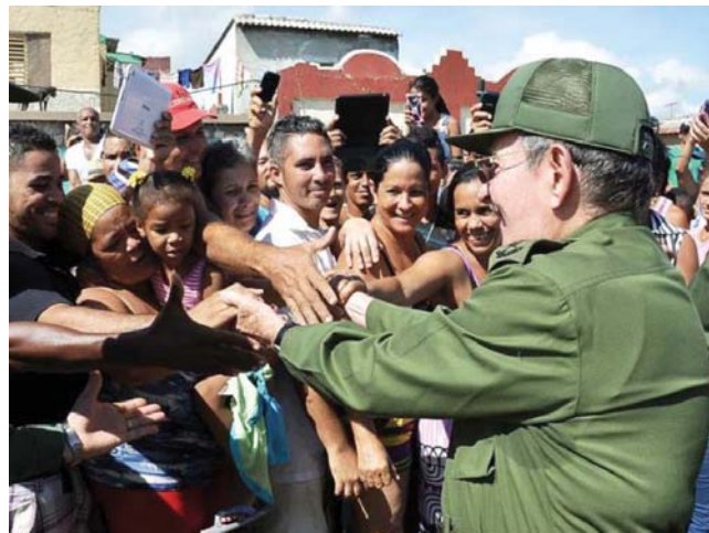
En intercambio con afectados por el huracán Matthew en Baracoa.