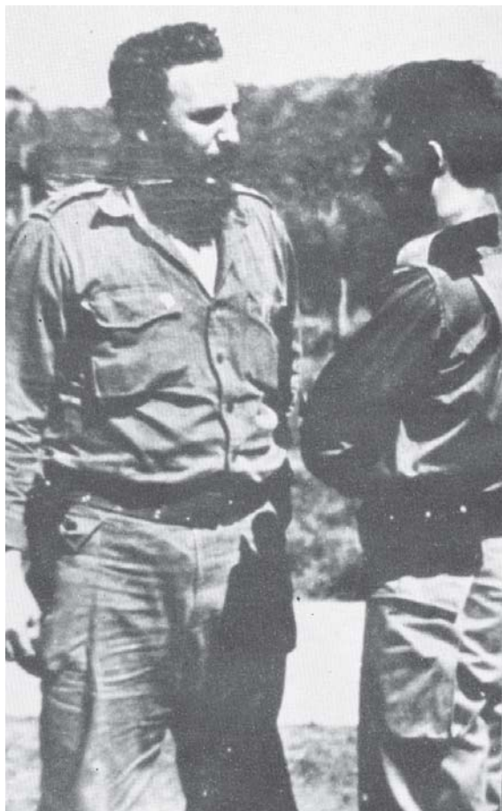
Junto a Fidel en Baracoa, en los primeros meses de la Revolución.

Insuficientes son unas pocas líneas para resumir, en su 90 cumpleaños, los incontables momentos de Raúl en esta tierra singular y heroica, y la impronta de su legado en los guantanameros.