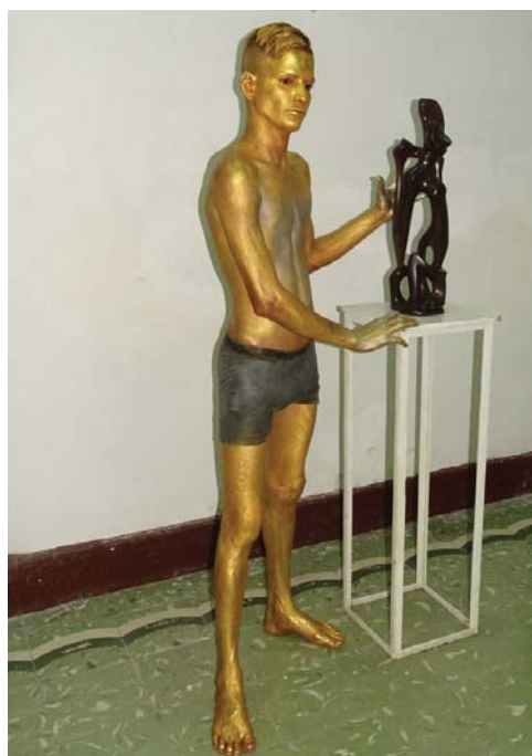
La convergencia de manifestaciones y técnicas artísticas, como el performance, es un valor a resaltar en el trabajo de la entidad.