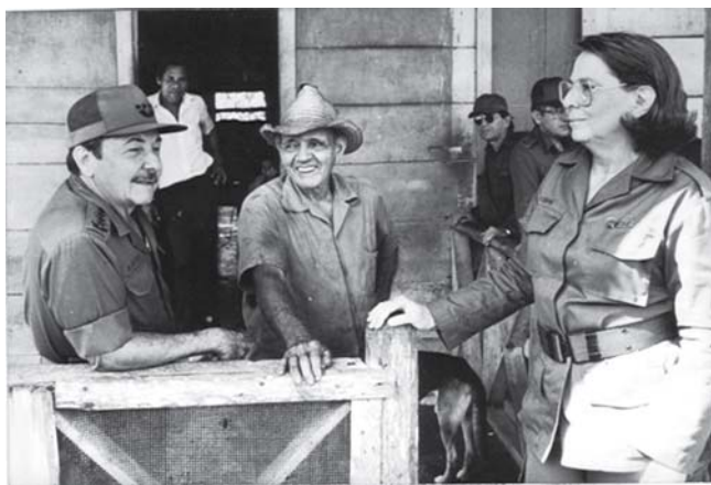
El General de Ejército, artífice del Programa del Plan Turquino.