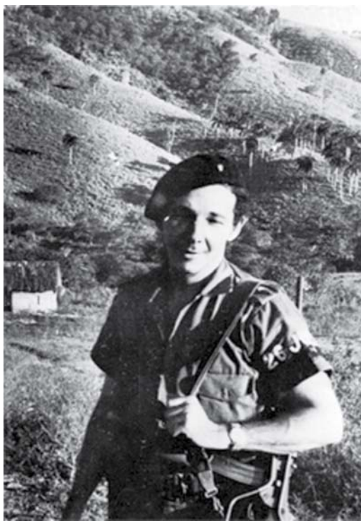
El comandante Raúl Castro, jefe del Segundo Frente Frank País García.