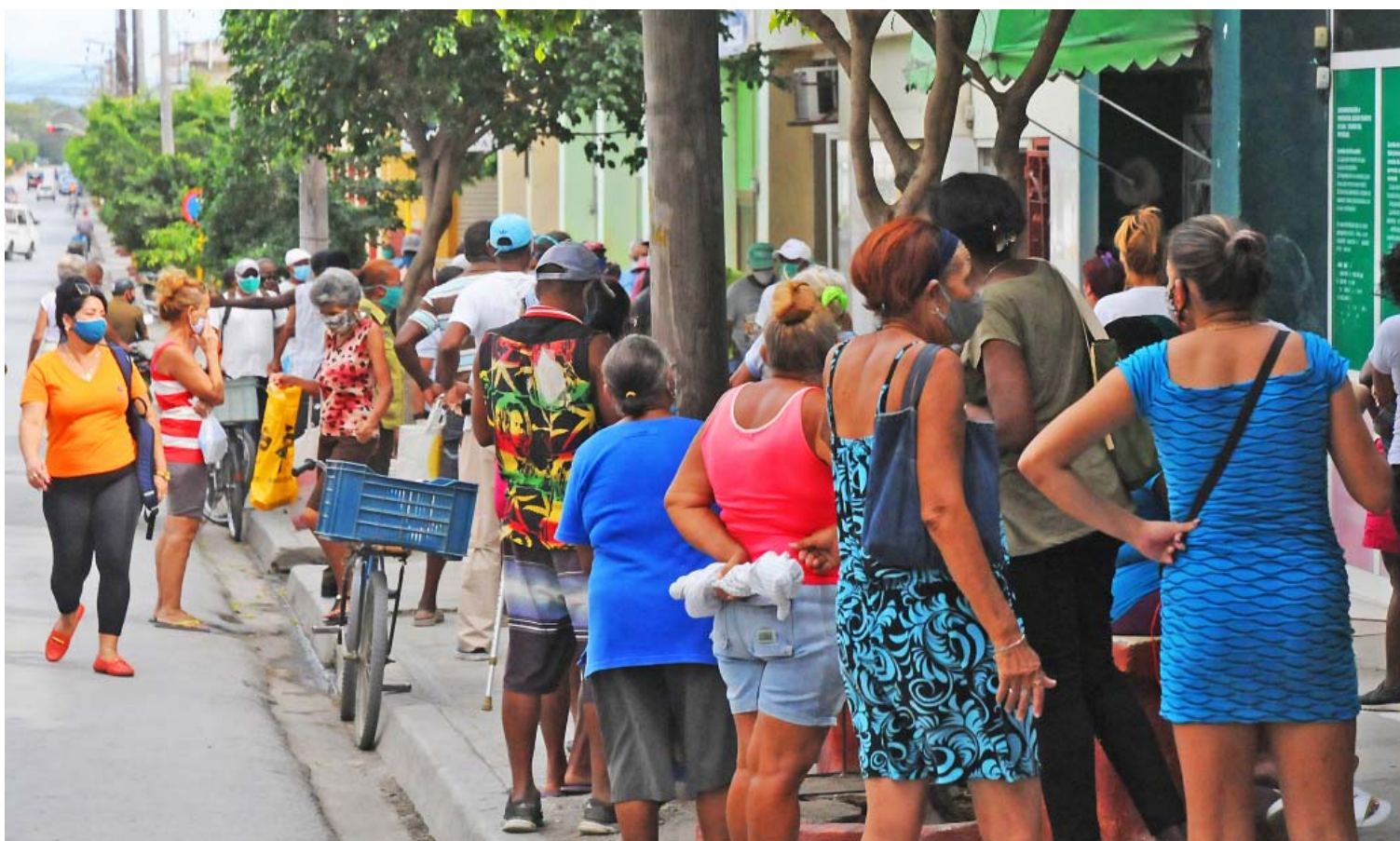
Violar las normas preventivas, como se aprecia en la foto, conduce a la proliferación del virus. A tu lado puede estar un asintomático.

Todo ello incide en que la tasa de incidencia de la COVID-19 en la provincia se eleve a 45.5 enfermos por cada 100 mil habitantes, para un total de 230 infectados desde el pasado 18 de mayo hasta la fecha.