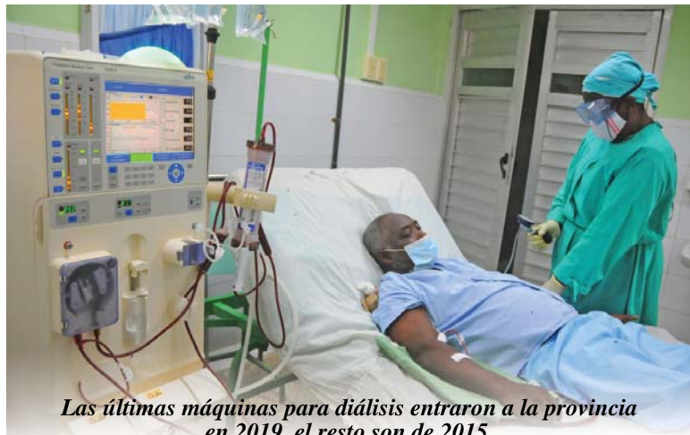
Las últimas máquinas para diálisis entraron a la provincia en 2019, el resto son de 2015.

"Por ejemplo, son 120 los guantanameros con IRC, quienes tres veces por semana acuden a los puestos de diálisis. Proviene de los 10 municipios, y se les atiende en el Agostinho Neto o en Baracoa, en dependencia de la cercanía, y se les garantiza no solo la atención, sino también el traslado y el alojamiento, de