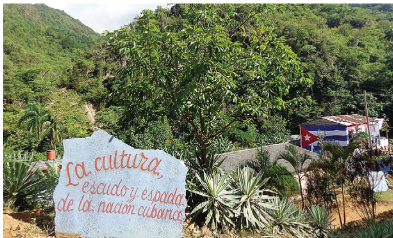
Dispersos en las serranías están la mayoría de los centros multigrados.

“Ellos se vinculan a diferentes tareas de impacto, como trabajo en la parcela de autoconsumo de cada localidad, y realizan guardia obrera en su centro de trabajo. Esto lo hacen, de acuerdo con un sistema de trabajo, además de continuar su autopreparación de manera individual donde planifican las evaluaciones sistemáticas y solucionan los ejercicios dejados en las teleclases para evacuar po-