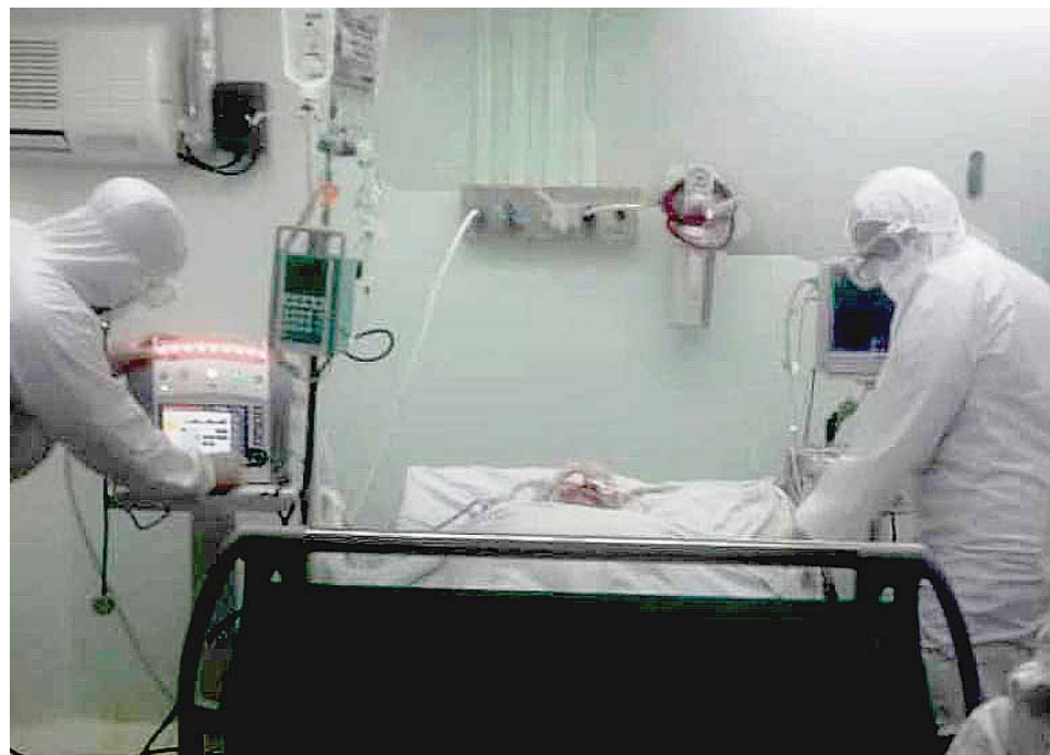
Guantánamo redujo la letalidad de pacientes críticos en la Terapia Intensiva a 0.21, índice inferior al del país.

Al resaltar el valor de esa entrega y dedicación humanas concluyó: "De las personas que llegan a Terapia Intensiva en estado crítico, en el mundo muere el 2.08 por ciento; en las Américas es peor: el 2.44, pero en Cuba, país bloqueado y tercermundista, la letalidad solo es del 0.68 por ciento, y en Guantánamo el 0.21, tres veces menos mortalidad que la media nacional".