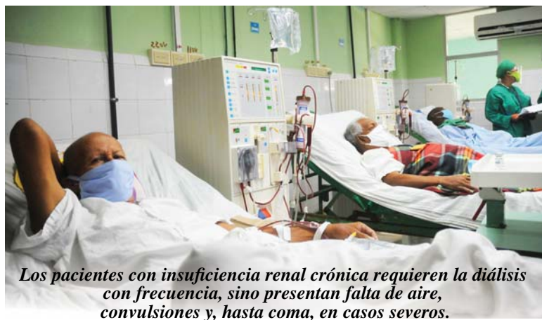
Los pacientes con insuficiencia renal crónica requieren la diálisis con frecuencia, sino presentan falta de aire, convulsiones y, hasta coma, en casos severos.