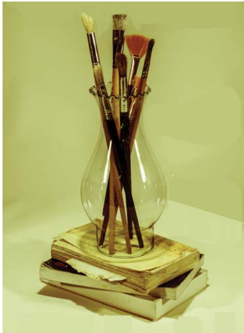
Las artes plásticas y la literatura "asaltarán" las redes sociales.

La inauguración de la Muestra bibliográfica