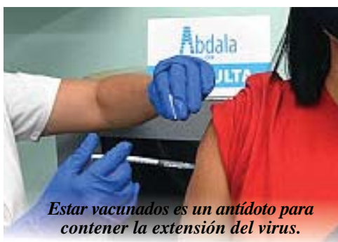
Estar vacunados es un antídoto para contener la extensión del virus.

Este último brote en el país europeo, que fuera uno de los epicentros de la enfermedad, demostró, sobre todo, que las vacunas ayudaban, pues los ancianos fueron priorizados en casi todo el mundo para su vacunación y dejaron de morir o, al menos, las