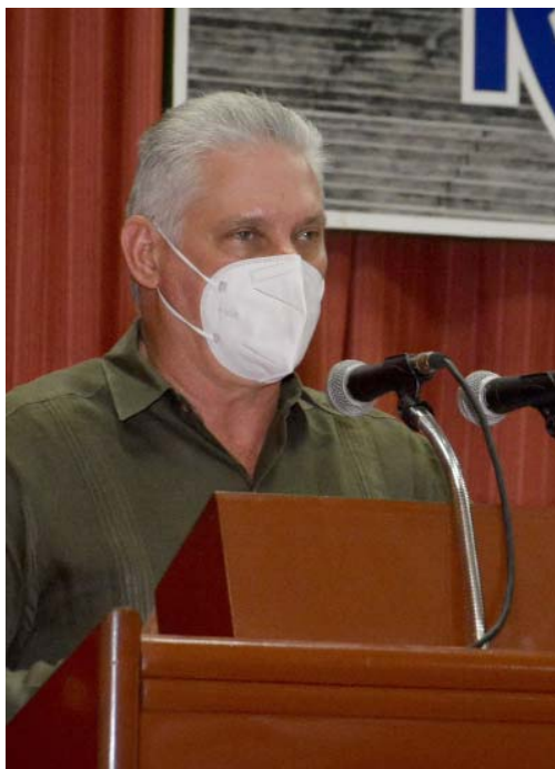
El papel de vanguardia política del Partido tiene que sustentarse en la ejemplaridad de su militancia, subrayó Díaz-Canel.