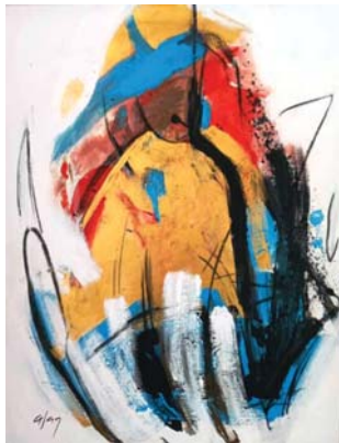
La pieza Ella sobresale entre las exhibidas en la muestra .