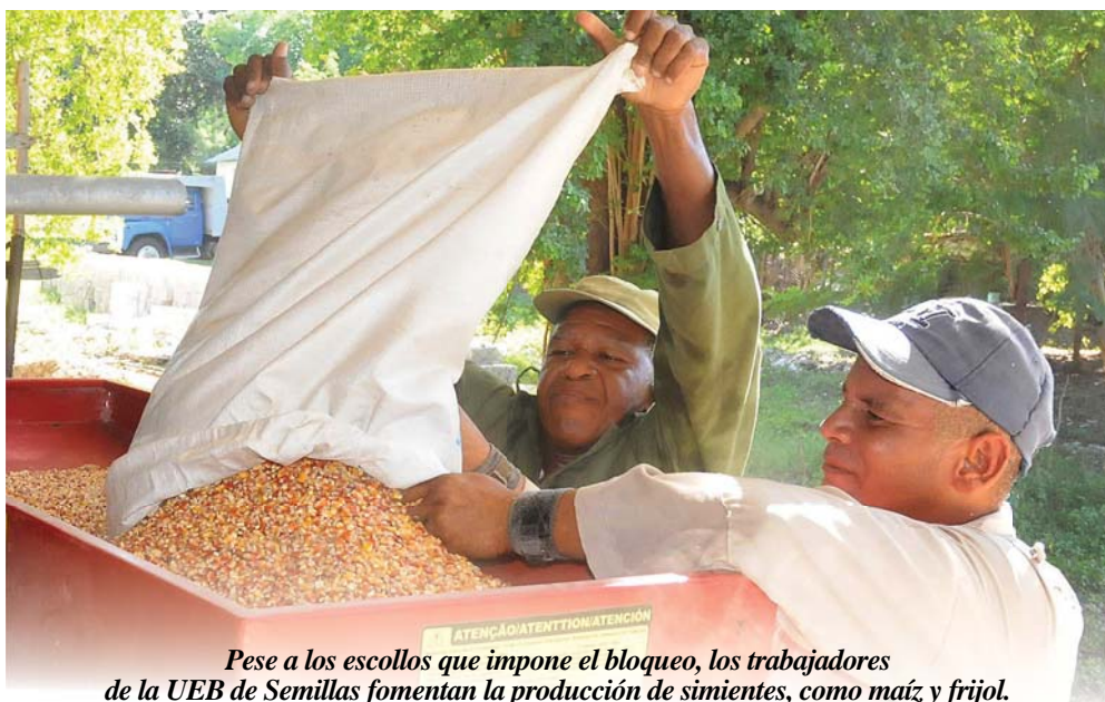
Pese a los escollos que impone el bloqueo, los trabajadores de la UEB de Semillas fomentan la producción de simientes, como maíz y frijol.

“Los núcleos de col, cebolla, zanahoria, lechuga..., renglones muy demandados por los guantanameros, deben ser comprados en otros países, porque las condiciones climáticas en el nuestro no permiten producirlos, sin embargo, en los últimos años prácti-