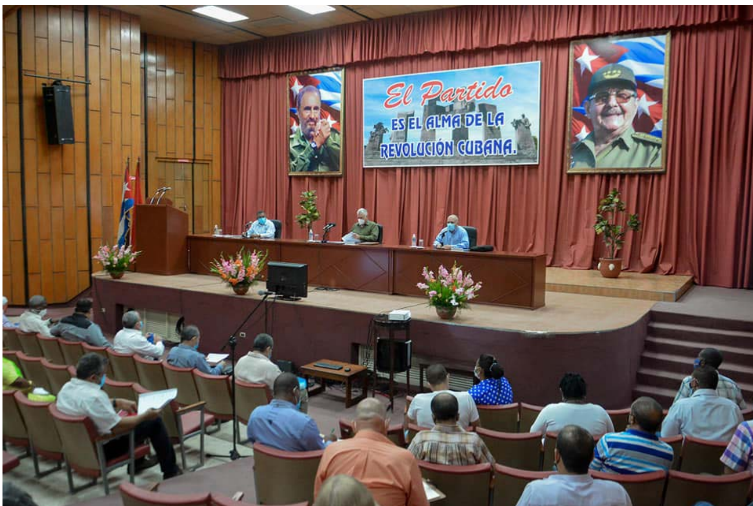
La implementación de la estrategia de seguimiento a las ideas, conceptos y directrices del 8vo. Congreso del Partido centró el intercambio del Primer Secretario del Comité Central e integrantes del Secretariado con los principales dirigentes de la provincia.

Igualmente, se analizaron los resultados del vínculo con las universidades de Guantánamo (UG), y de Ciencias Médicas, el Centro para el Desarrollo de la Montaña, de El Salvador, y el Parque tecnológico de la UG, para materializar proyectos de desarrollo local, el reordenamiento del Comercio Interior, el encadenamiento productivo, el perfeccionamiento del programa azucarero y de la empresa estatal socialista.