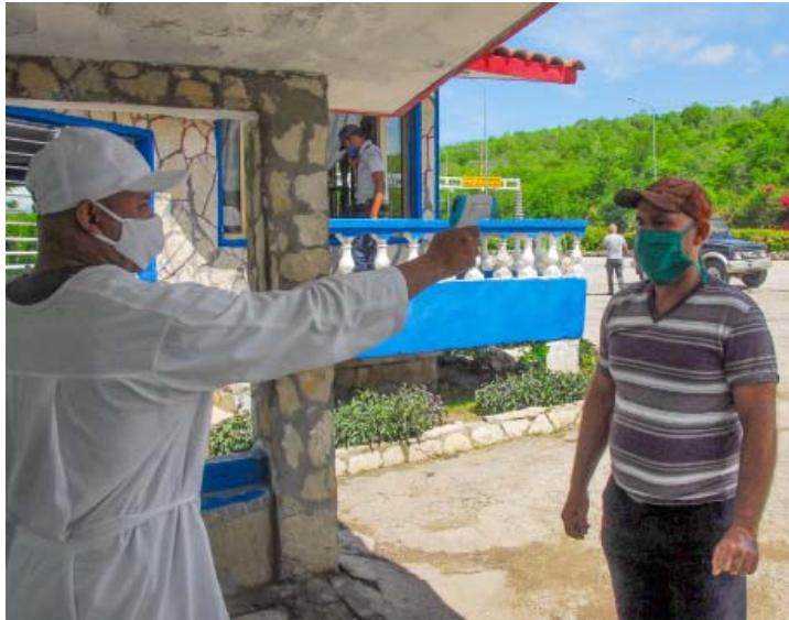
El control a viajeros se inicia en los puntos de acceso a la provincia, pero tiene que continuar en el destino domiciliar, donde es obligatorio permanecer 10 días en aislamiento.

El número de barriadas con transmisión provoca 78 controles de foco, y exhibe más de 800 contactos de casos positivos. Los sospechosos totalizan 206 pacientes, de los cuales 11