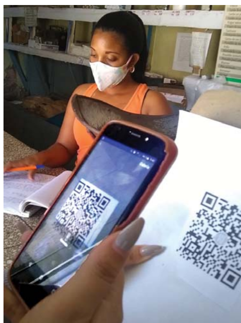
Cerca de 300 unidades en la provincia utilizan el comercio electrónico para realizar pagos a través de la aplicación Enzona.