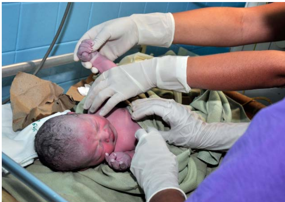
Este año se incrementa la natalidad, pero también la mortalidad, fundamentalmente, por el bajo peso al nacer.

Les aplicamos medicamentos para la maduración pulmonar, antibióticos, protección al sistema nervioso central... Eso da mejores condiciones a esos bebés, pero si la mamá se niega