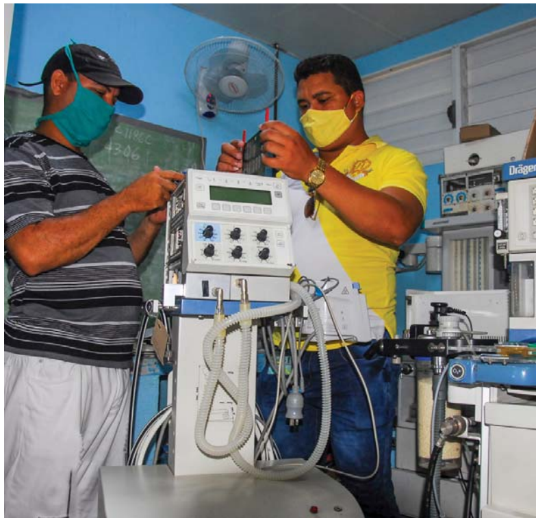
Después de varios meses roto, este equipo de ventilación para el servicio de Neonatología espera por una pieza, cuya llegada al país está irremediablemente signada por los efectos del bloqueo.

"Si hoy solo tenemos recursos para soldar un cable, por ejemplo, ahí nos quedamos. Porque el innovador en el sector de la