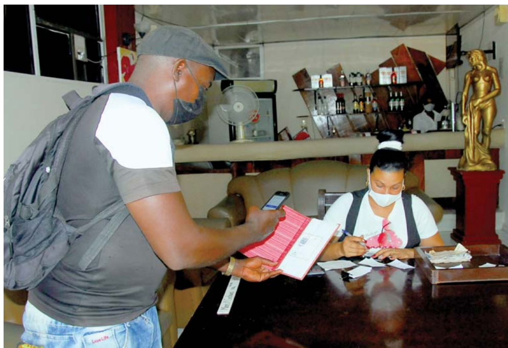
La Unidad Empresarial de Base La Avellaneda reporta el mayor número de clientes e ingresos de venta, utilizando el pago en línea.

que cuentan con 198 establecimientos, de ellos en 176, desde finales de 2020, funciona el comercio electrónico, que incluye bodegas, supermercados, carnicerías, mercados ideales, tiendas de materiales de la construcción y complejos comerciales. En cada una de las unidades, apuntó,