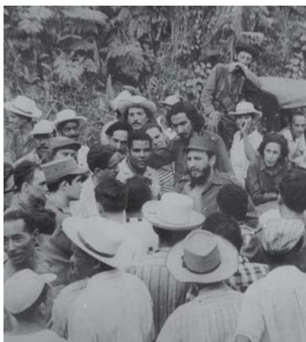
Campesinos congregados junto a Fidel respaldaron los planes de industrialización y desarrollo agrícola de La Primada de Cuba.

En su periplo de la época, Fidel, a la sazón Primer Ministro del Gobier-