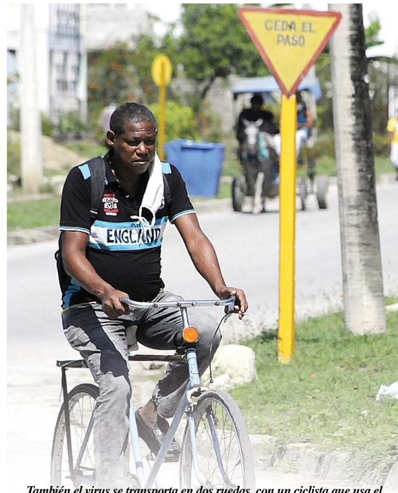
También el virus se transporta en dos ruedas, con un ciclista que usa el nasobuco enganchado de una oreja. ¿Qué estilo!