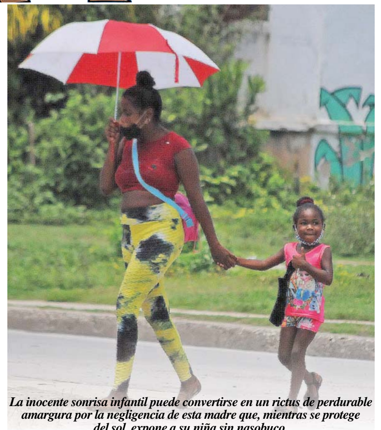
La inocente sonrisa infantil puede convertirse en un rictus de perdurable amargura por la negligencia de esta madre que, mientras se protege del sol, expone a su niña sin nasobuco.