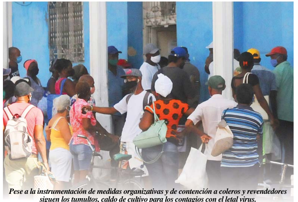
Pese a la instrumentación de medidas organizativas y de contención a coleros y revendedores siguen los tumultos, caldo de cultivo para los contagios con el letal virus.