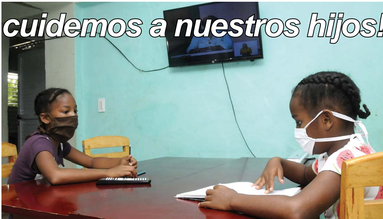
Las casas de niños sin amparo familiar, el Centro de Atención Especializada de la conducta, los hogares Maternos y de Ancianos son instituciones bajo el chequeo de las autoridades fiscales.

Ante violaciones in fraganti y en los casos reiterativos o de mayor gravedad se aplicaron multas administrativas, detalla la fiscal, quien apunta su preocupación por la falta