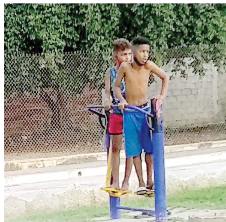
Las cifras de contagios por la COVID-19 en edades pediátricas van en aumento, como también la presencia de niños jugando al libre albedrío. ¿Qué hacer y cuándo hacer con sus padres?