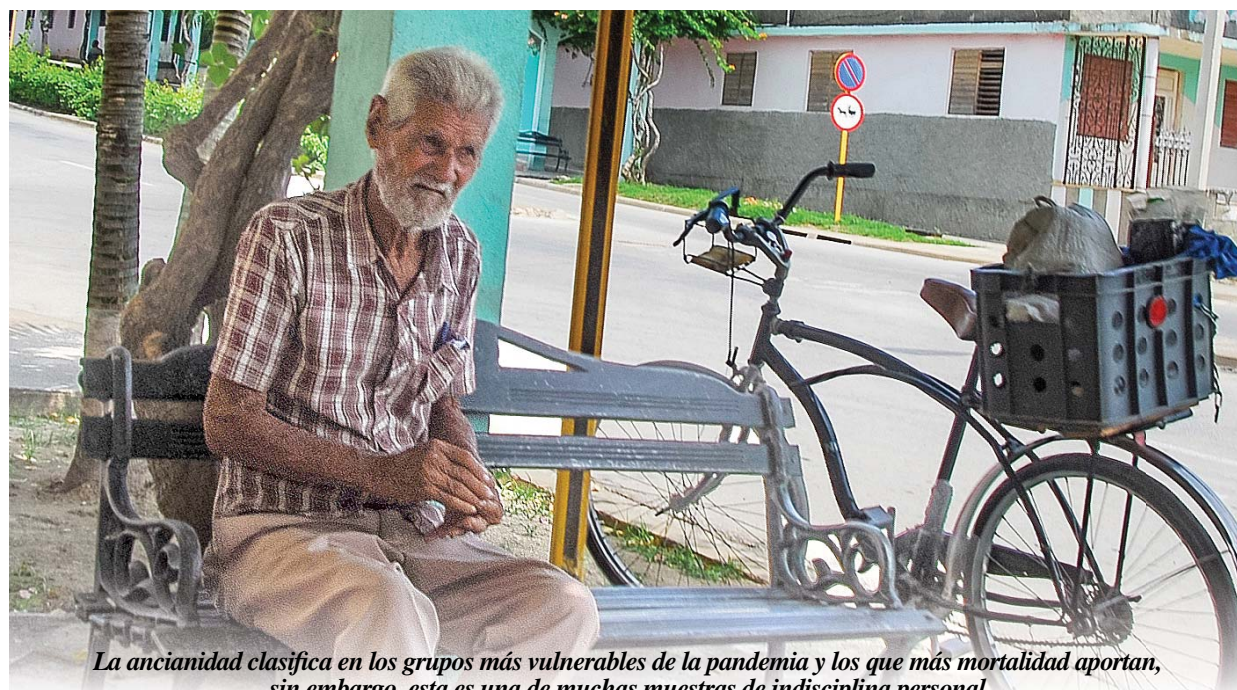
La ancianidad clasifica en los grupos más vulnerables de la pandemia y los que más mortalidad aportan, sin embargo, esta es una de muchas muestras de indisciplinación personal.