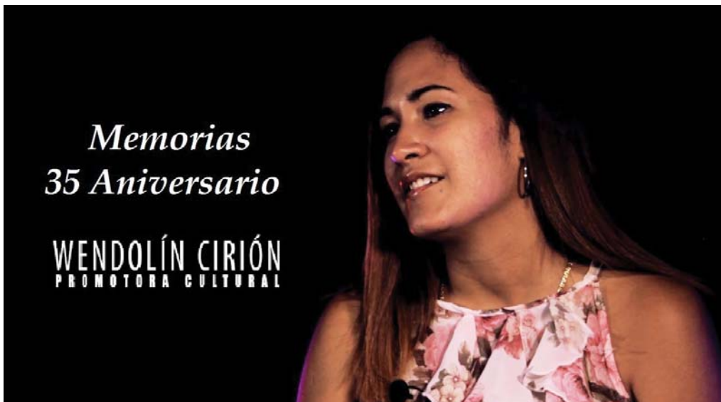
Fragmento de la serie producida en Baracoa por el aniversario 35 de la AHS.

buyan a salvaguardar la memoria colectiva de la organización, al mismo tiempo que se visibilice la AHS en Guantánamo, en el resto del país y en el mundo, pues servirán como herramientas para divulgar el devenir de la vanguardia de jóvenes artistas, tanto en plataformas digitales como tradicionales”, aseguró Rodríguez de la Cruz.