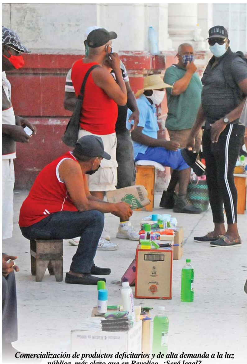
Comercialización de productos deficitarios y de alta demanda a la luz pública, más claro que en Revolico. ¿Será legal?