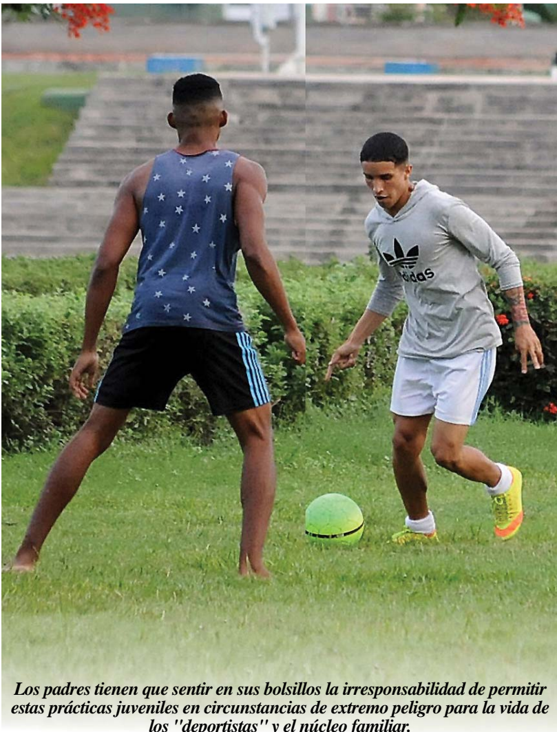
Los padres tienen que sentir en sus bolsillos la irresponsabilidad de permitir estas prácticas juveniles en circunstancias de extremo peligro para la vida de los "deportistas" y el núcleo familiar.

Pero poco podrán hacer sin el empuje positivo de los demás, de quienes hoy rompen