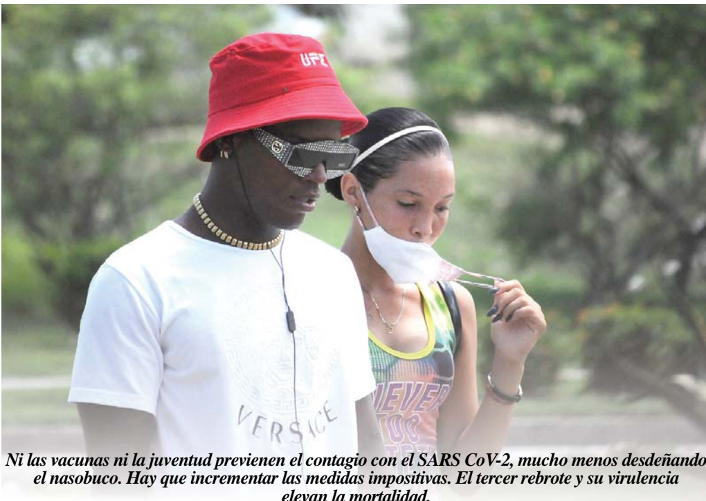
Ni las vacunas ni la juventud previenen el contagio con el SARS CoV-2, mucho menos desdeñando el nasobuco. Hay que incrementar las medidas impositivas. El tercer rebrote y su virulencia elevan la mortalidad.