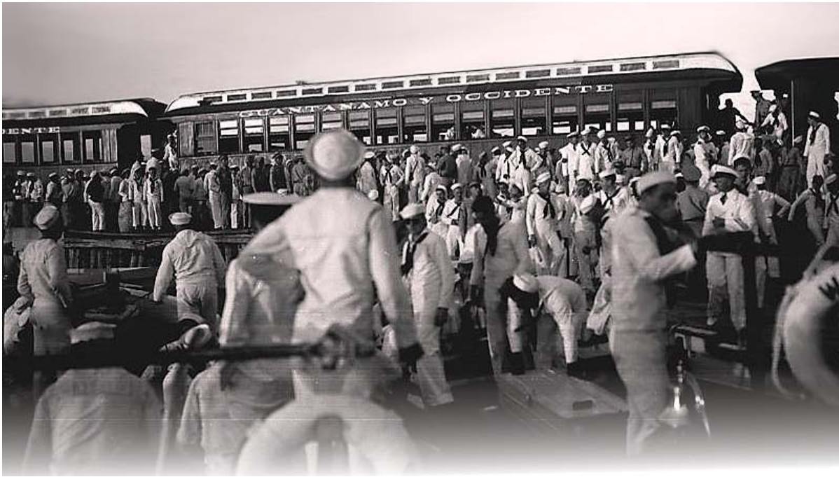
La presencia de los marines en Guantánamo constituyó una verdadera pesadilla para el pueblo.

promedio la cifra más alta de la nación en los enfermos de sífilis y lepra, también el primer lugar en la producción de marihuana, que abastecía a los marines y a parte del mercado ilícito nacional y del Caribe.