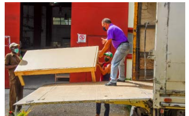
Las camas son destinadas a centros de aislamiento habilitados por la COVID-19 en Guantánamo.

Muebles Imperio continúa sus producciones destinadas a instalaciones turísticas del país y, entre sus clientes potenciales, destaca el hotel Iberostar Albatros, del balneario Guardalavaca, que debe convertirse en el más