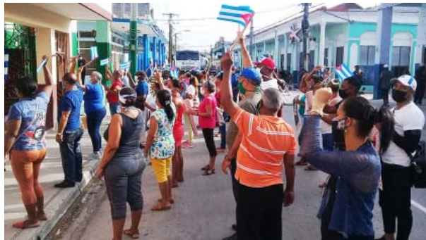
Acto de reafirmación revolucionaria frente a la sede de la CTC en la provincia.

Condenó las movilizaciones insidiosas que violan los protocolos sanitarios y decretos legales contra la pandemia, las cuales donde único encajarían es frente a la embajada del país nor-