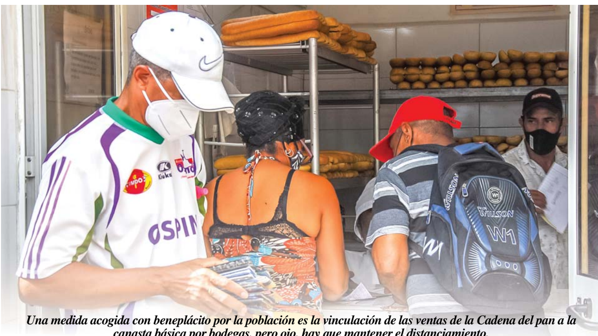
Una medida acogida con beneplácito por la población es la vinculación de las ventas de la Cadena del pan a la canasta básica por bodegas, pero ojo, hay que mantener el distanciamiento.