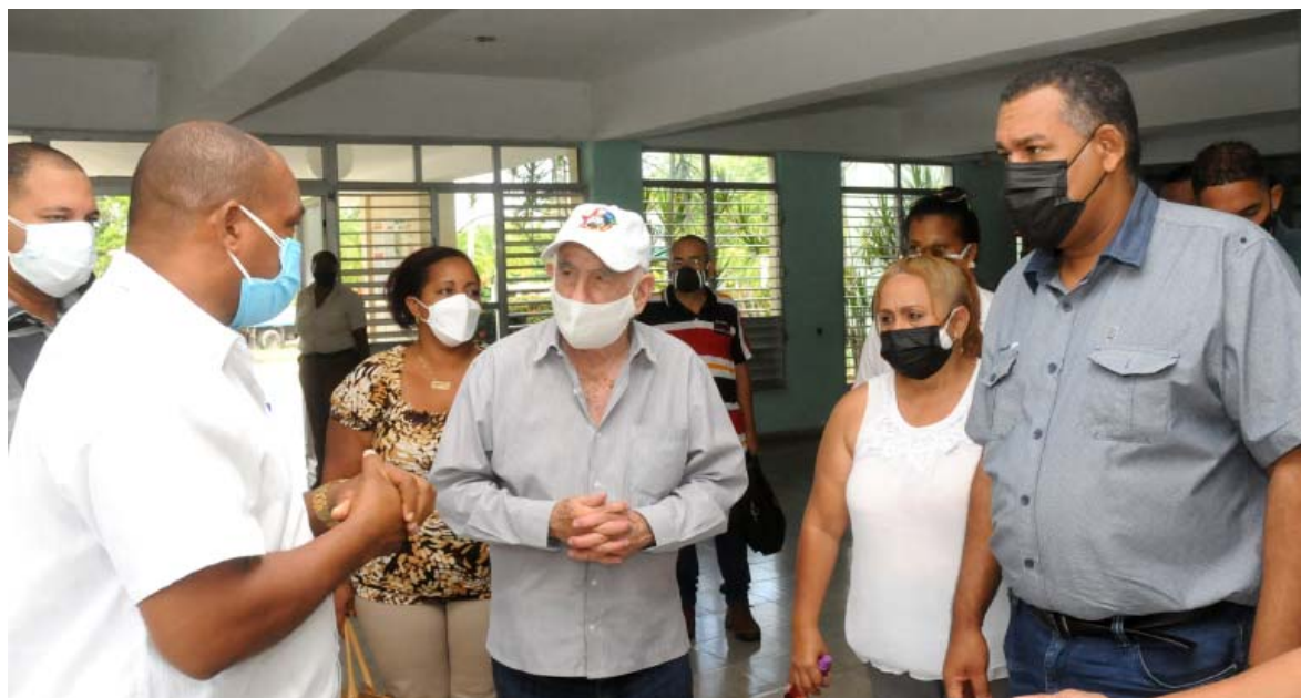
El Comandante del Ejército Rebelde departió con directivos del policlínico Francisco Castro Ceruto, en El Salvador.

ÓRGANO OFICIAL DEL COMITÉ PROVINCIAL DEL PARTIDO EN GUANTÁNAMO