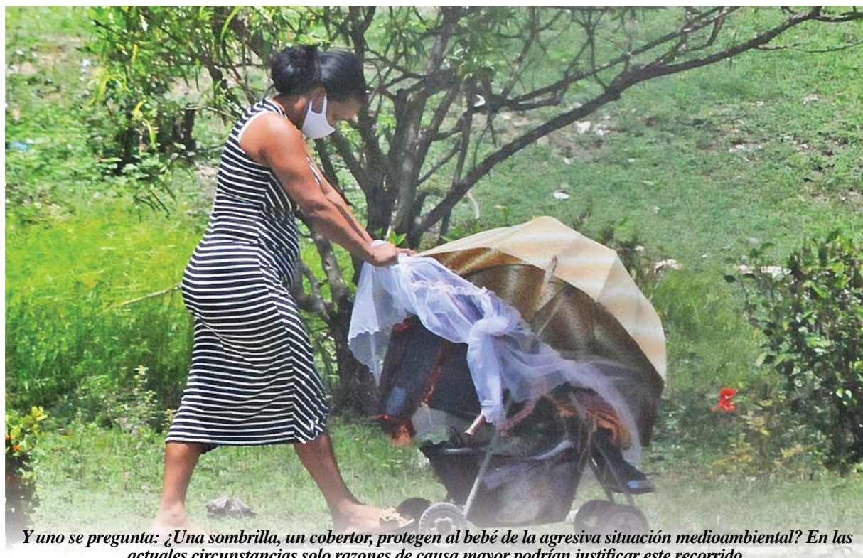
Y uno se pregunta: ¿Una sombrilla, un cobertor, protegen al bebé de la agresiva situación medioambiental? En las actuales circunstancias solo razones de causa mayor podrían justificar este recorrido.

El SARS CoV-2, con sus nuevas y más contagiosas variantes mutacionales, aguarda por los incautos en cada esquina, en cada cola, en cada tumulto, fiesta o reunión, y luego con ellos traspone la puerta de la vivienda, se ceba en la familia y ocurre que, un miembro contagiado, tiene que salir por esa misma puerta, quizás con el postrer y definitivo adiós. Puede que nunca más vea a los suyos, ni que estos tengan oportunidad de despedir el cadáver. Así de fácil, así de duro.