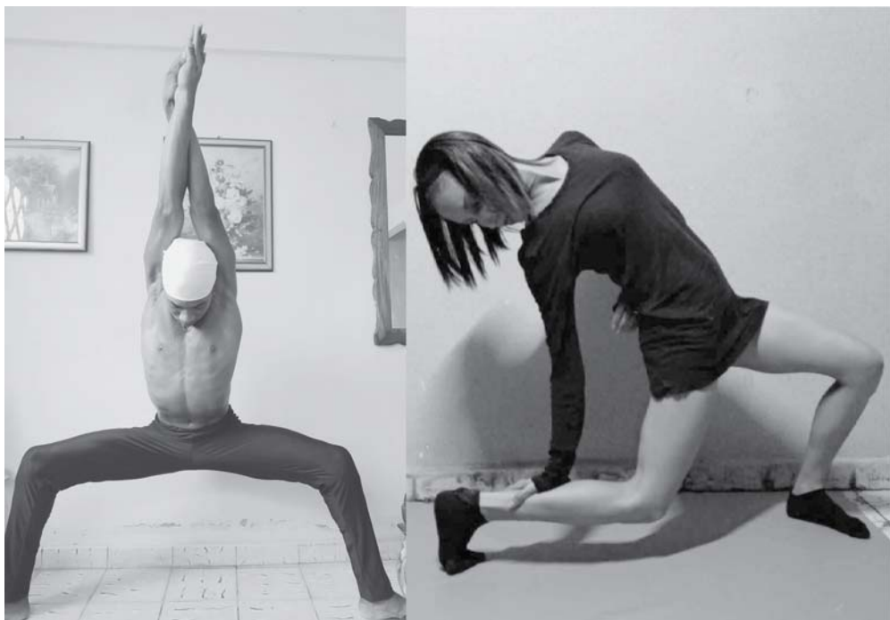
Bailarines guantanameros activos en casa, listos para volver a los escenarios.

Los eventos estarán repartidos en más de 40 sedes, y aunque la mayoría de las competiciones se realizarán en Tokio, habrá algunas en otras zonas de Japón. Dentro de la capital, unas tendrán lugar en antiguas instalaciones de las Olimpiadas de 1964 y otras en nuevos emplazamientos, cerca de la bahía de la ciudad.