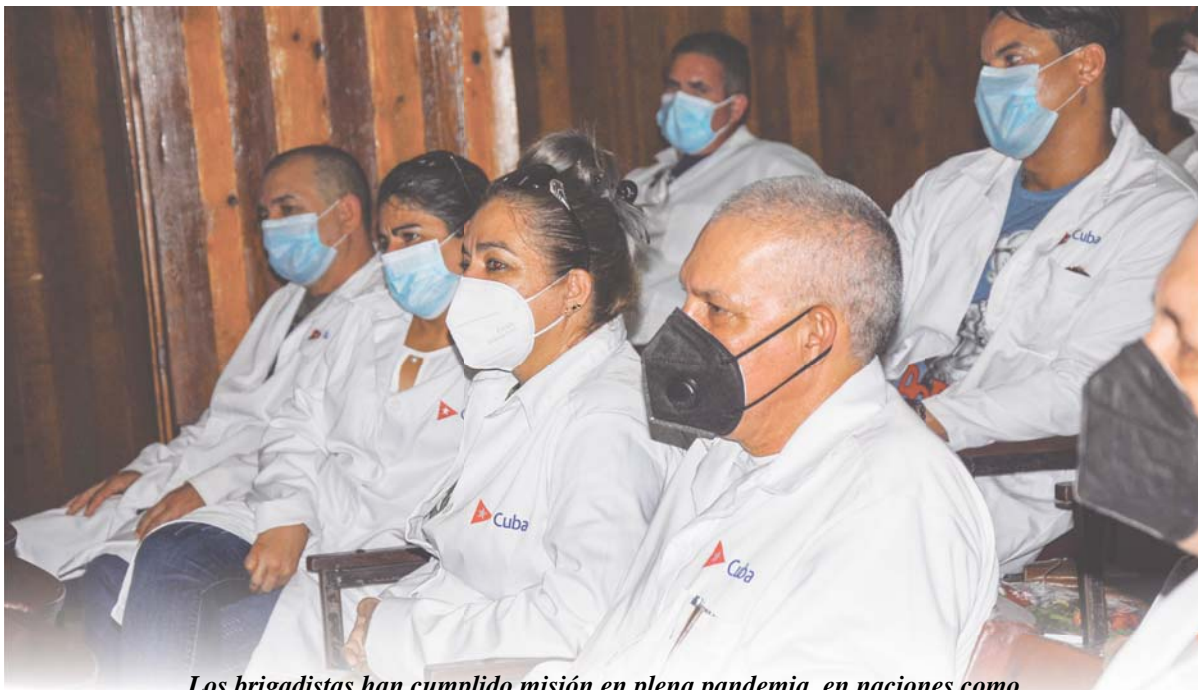
Los brigadistas han cumplido misión en plena pandemia, en naciones como México e Italia, con alta transmisión del virus.

"Apenas hemos descansado, casi ni vimos a la familia, nos avisaron que nos necesitaban y enseguida dimos el sí, por Guantánamo, y por Cuba. Estamos seguros de que contribuiremos a aliviar la terrible tensión que existe en la provincia, así que cuenten con nosotros", afirmó la experimentada enfermera que acumula en