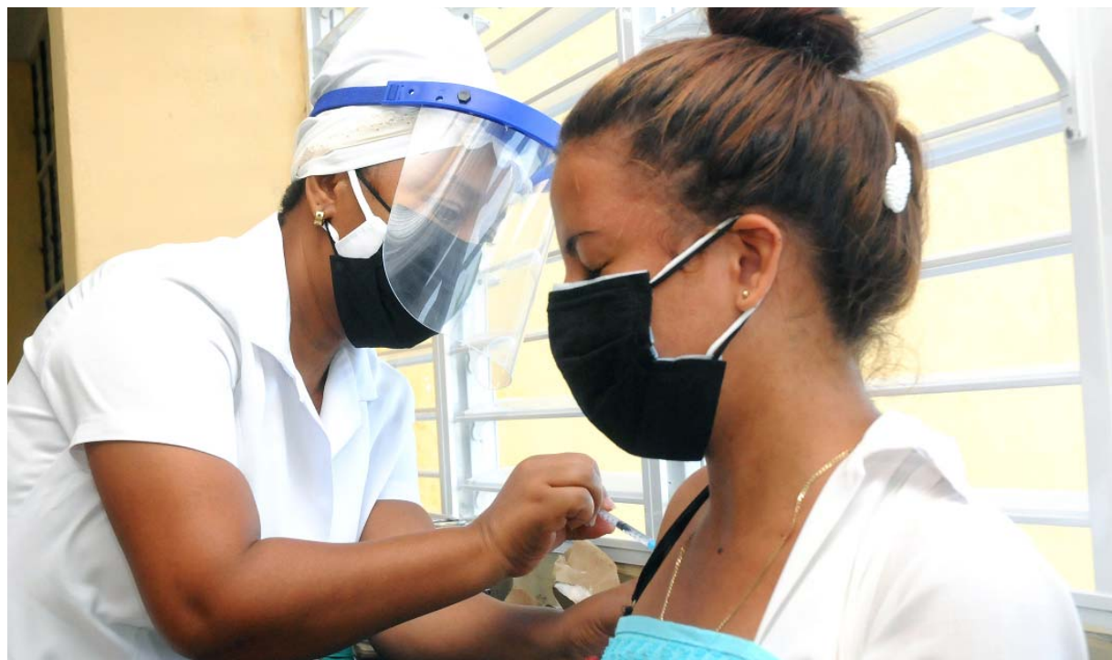
Soberana Plus se aplica a 120 estudiantes de Medicina que contrajeron la COVID-19.

Estudiantes de la Universidad de Ciencias Médicas, de Guantánamo, que padecieron la COVID-19 recibieron la dosis de Soberana Plus, inmunógeno destinado a convalecientes de la enfermedad.