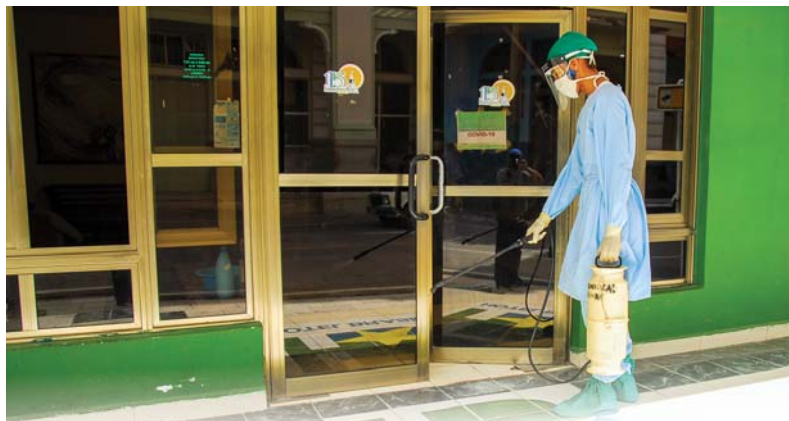
El Hotel Brasil, hoy Hospital Brasil, acoge a una veintena de confirmados.

En el afán por aislar a todo aquel que pueda constituir un riesgo para la comunidad, o cuyo estado de salud lo haga vulnerables, las autoridades territoriales habilitan más instituciones para controlar la propagación.