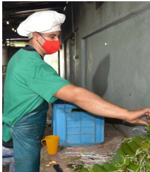
Generalmente, hay un promedio de siete u ocho ofertas en el negocio. El guanimo, a base de plátano, casi siempre es una de ellas.

Para completar el ciclo productivo, mientras la tierra alimenta a los lechones, la cochiquera también aporta a las