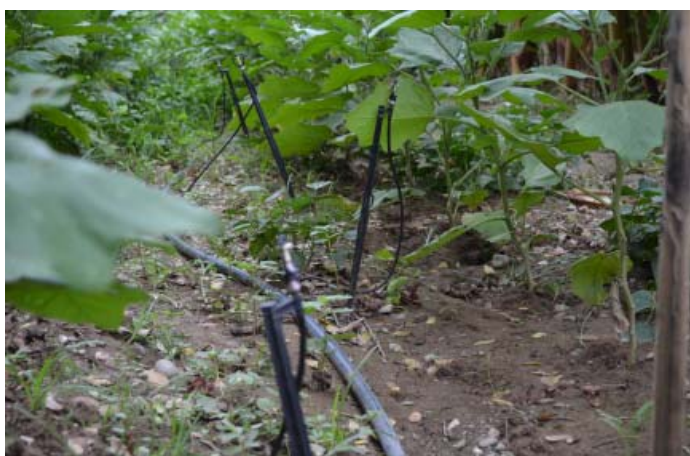
Unos 25 productores se beneficiaron con equipos de riego capaces de irrigar cultivos de manera más eficiente, sobre todo, con sistemas de goteo y microaspersión (en la foto). De las tierras favorecidas, solo 66 hectáreas están en manos estatales, el resto correspondió a campesinos y usufructuarios.