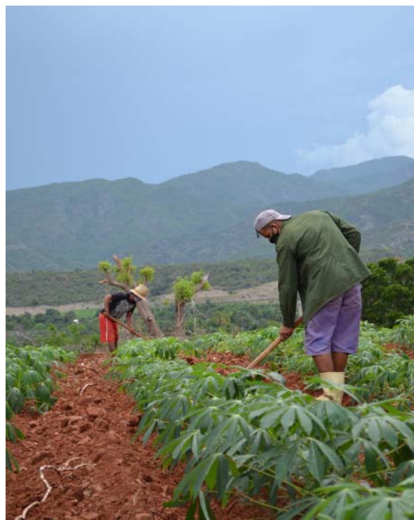
Imías , que antes del riego era el municipio con menor per cápita del país (de 12 a 14 libras entre viandas, vegetales...), con el agua en los campos logró abrir nuevas áreas productivas, incrementó la productividad de cultivos como el tomate -de cinco a 10 toneladas por hectárea- y casi llega a las 30 libras por habitante exigidas por el Programa de autoabastecimiento municipal.