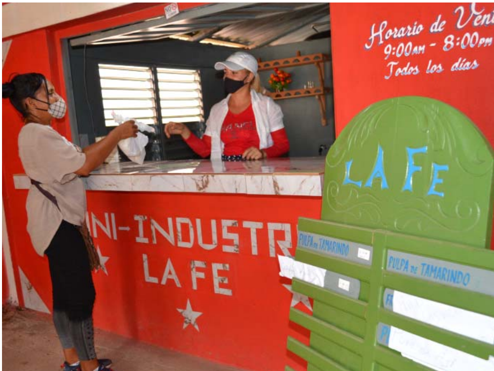
La idea de La Fe bien vale ser “clonada” como experiencia válida para aprovechar las producciones que, a pesar de todo, todavía se pierden en el campo.

En la machera de La Ceiba, ahora a cargo de su padre “que es inspiración y fuerza”, los puercos seguían mermando, a pesar de los esfuerzos en la finca, y con esa preocupación en la cabeza “maduró” la idea de La Fe, en una noche entera sin dormir.