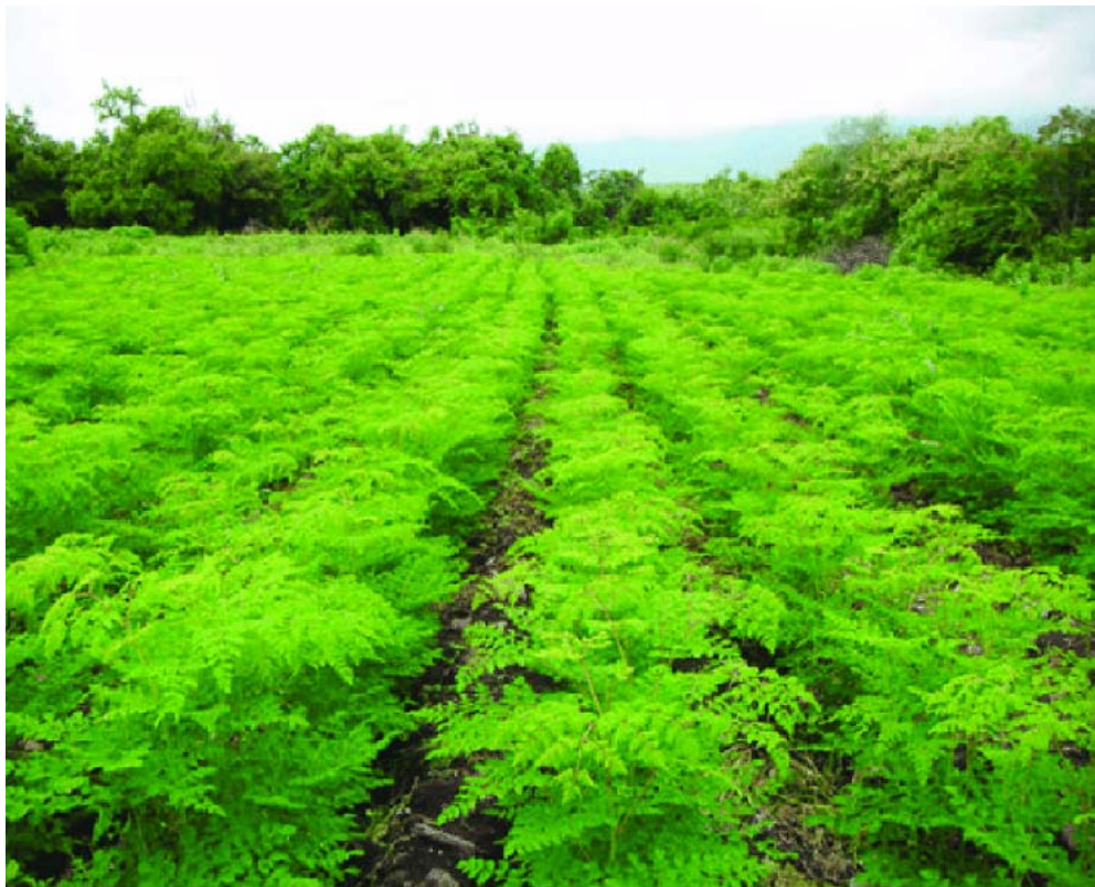
A la provincia de Guantánamo le queda mucho camino por andar en el desarrollo de las potencialidades que brindan las plantas proteicas para la alimentación animal. En la gráfica un campo de moringa oleífera.

"El retroceso del programa en Guantánamo es evidente, sin embargo, provincias como Las Tunas, con prácticamente las mismas condiciones y problemáticas que la nuestra, exhiben mayor cultura ganadera y mejores resultados en la protección de las áreas y la producción de semillas tras