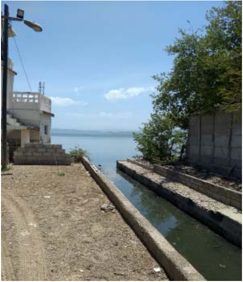
Las dos zanjas de Caimanera vierten directamente a la bahía, lo que viola lo dispuesto por la Norma cubana 521.

Son limitados los estudios relacionados con el impacto de esta situación sobre la biodiversidad de la bahía guantanamera,