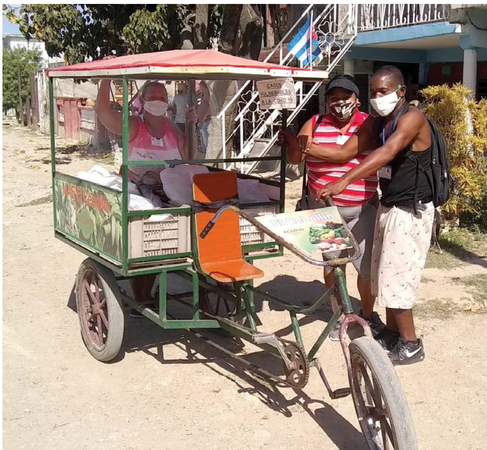
Mensajeros de la Circunscripción 11, del Consejo Popular San Justo.

“A nivel de Consejo Popular se organizó esta tarea de conjunto con el Combinado Deportivo ubicado en la propia barriada, del que nos fueron asignados 10 Licenciados en Cultura Física y dos profesores del mismo sector, que labo-