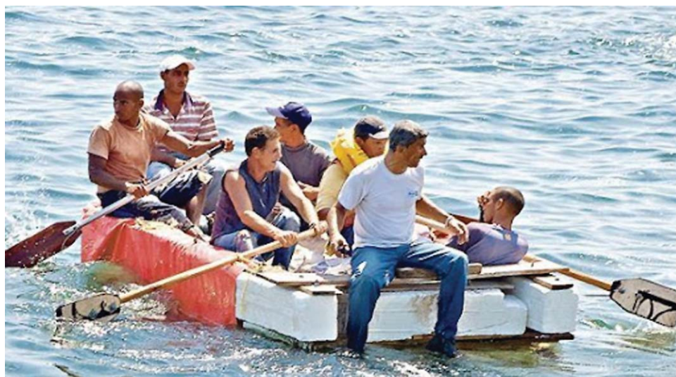
El hundimiento real o simulado de una embarcación llena de cubanos en ruta hacia la Florida, esa emigración desordenada que Estados Unidos alienta con su “Ley de Ajuste”, figura entre las criminales elucubraciones del norte brutal que nos desprecia.

Obsesionados con la idea de borrar del mapa a la Revolución cubana han mentido sin escrúpulos, han maquinado los más siniestros planes. Ahora, por otras vías, las mentiras se repiten, pero su fin será el mismo: el más rotundo fracaso.