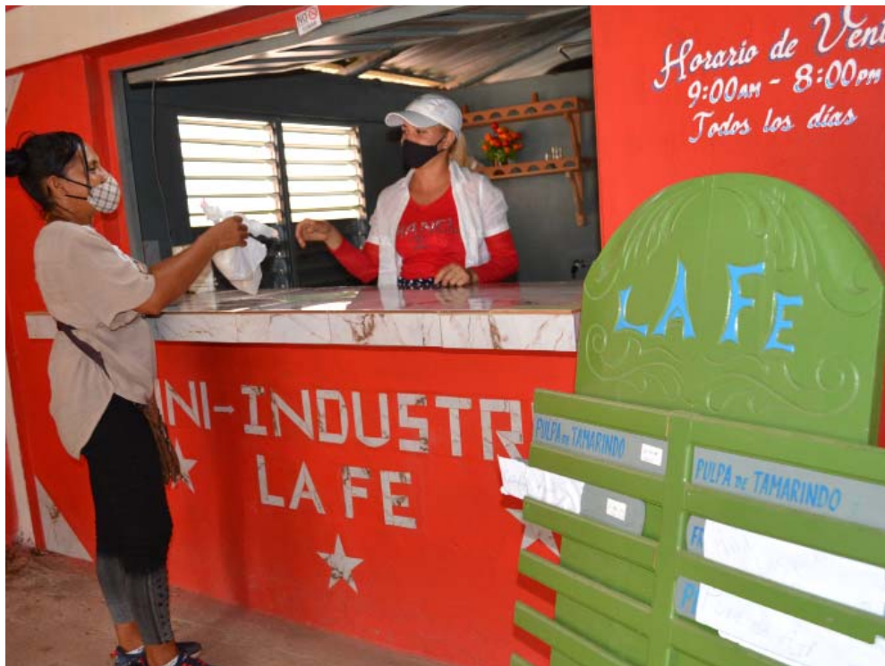
La idea de La Fe bien vale ser “clonada” como experiencia válida para aprovechar las producciones que, a pesar de todo, todavía se pierden en el campo.