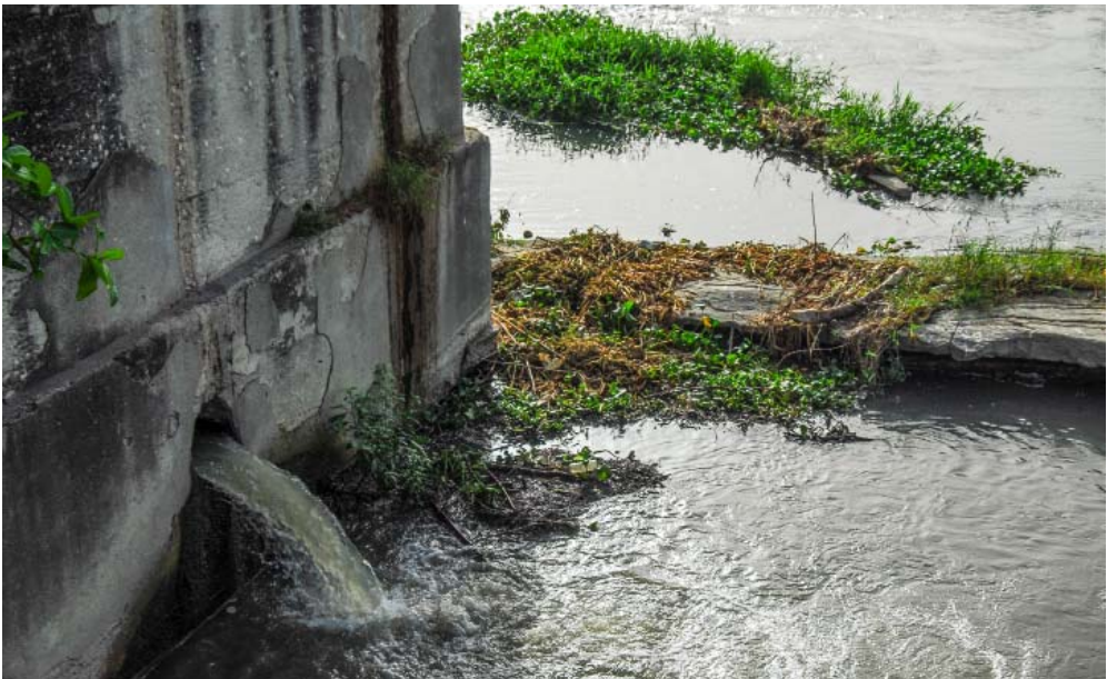
Residuales fuera de los parámetros establecidos por la Norma 27 comienzan su viaje hacia la bahía por el río Guaso.

la bahía debido a los residuales generados en Caimanera no es la salina, la cual cuenta con facilidades de tratamiento al igual que el alcantarillado.