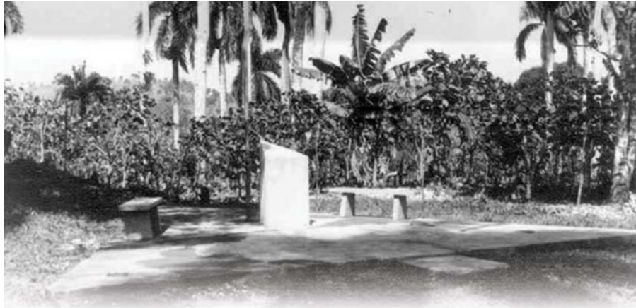
Tarja de señalización, próxima a las ruinas del cafetal La Indiana, Monumento Nacional.