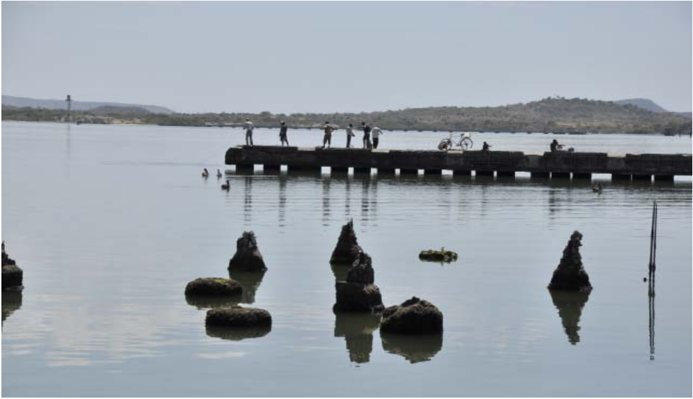
La contaminación de la bahía guantanamera ha sido objeto de varias investigaciones, y se advierten afectaciones a peces y moluscos.

La investigación concluyó en que los residuales de la Empresa de Bebidas y Refrescos y la Fábrica de galletas presentaban altos contenidos de sólidos