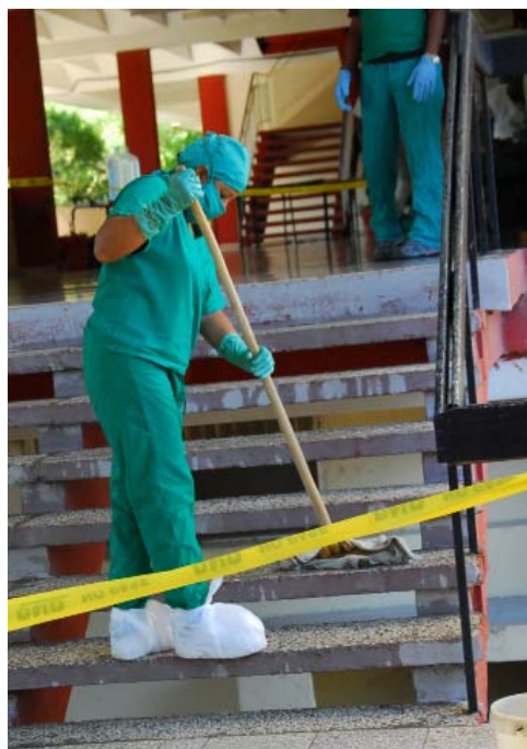
La ejecutoria del personal de servicios (limpieza, camilleros, mensajeros, pantristas, cocineros...) será evaluada diariamente.

8- Chequeo de los recursos e insumos médicos y no médicos para asegurar los procesos asistenciales (medicamentos, material gastable, test rápido, medios de protección, alimentación).