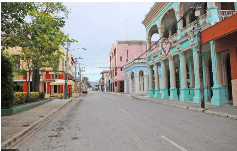
El movimiento vehicular queda restringido a partir de las 15:00 horas.