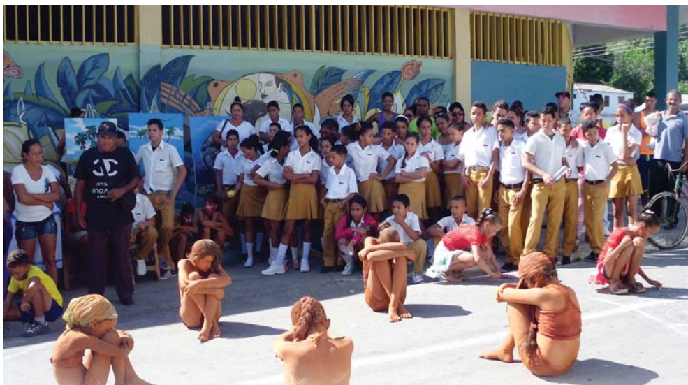
El proyecto integra niños y adolescentes, quienes aprenden a apreciar las artes plásticas en carne propia.