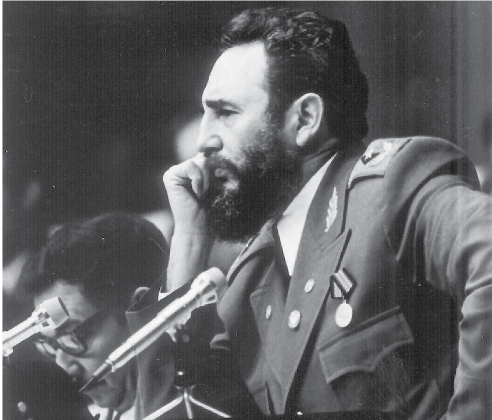
Fidel forjó la resistencia y las conquistas de un pueblo libre y soberano frente al enemigo más poderoso de la tierra.

Y a pesar de las agresiones, los sabotajes, las calumnias y las manipulaciones, y el bloqueo económico, comercial y financiero recrudescido en la actualidad, y