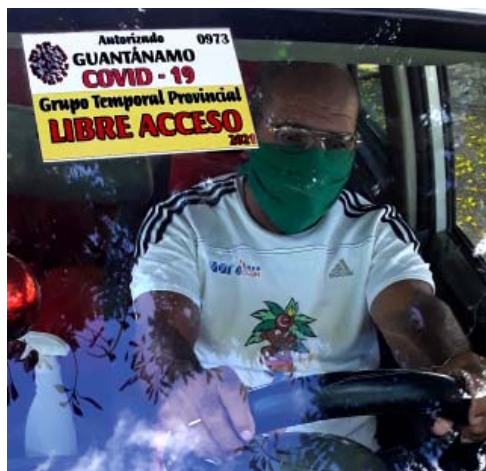
Un reducido número de vehículos circulará 24 horas, identificados con una pegatina oficial.