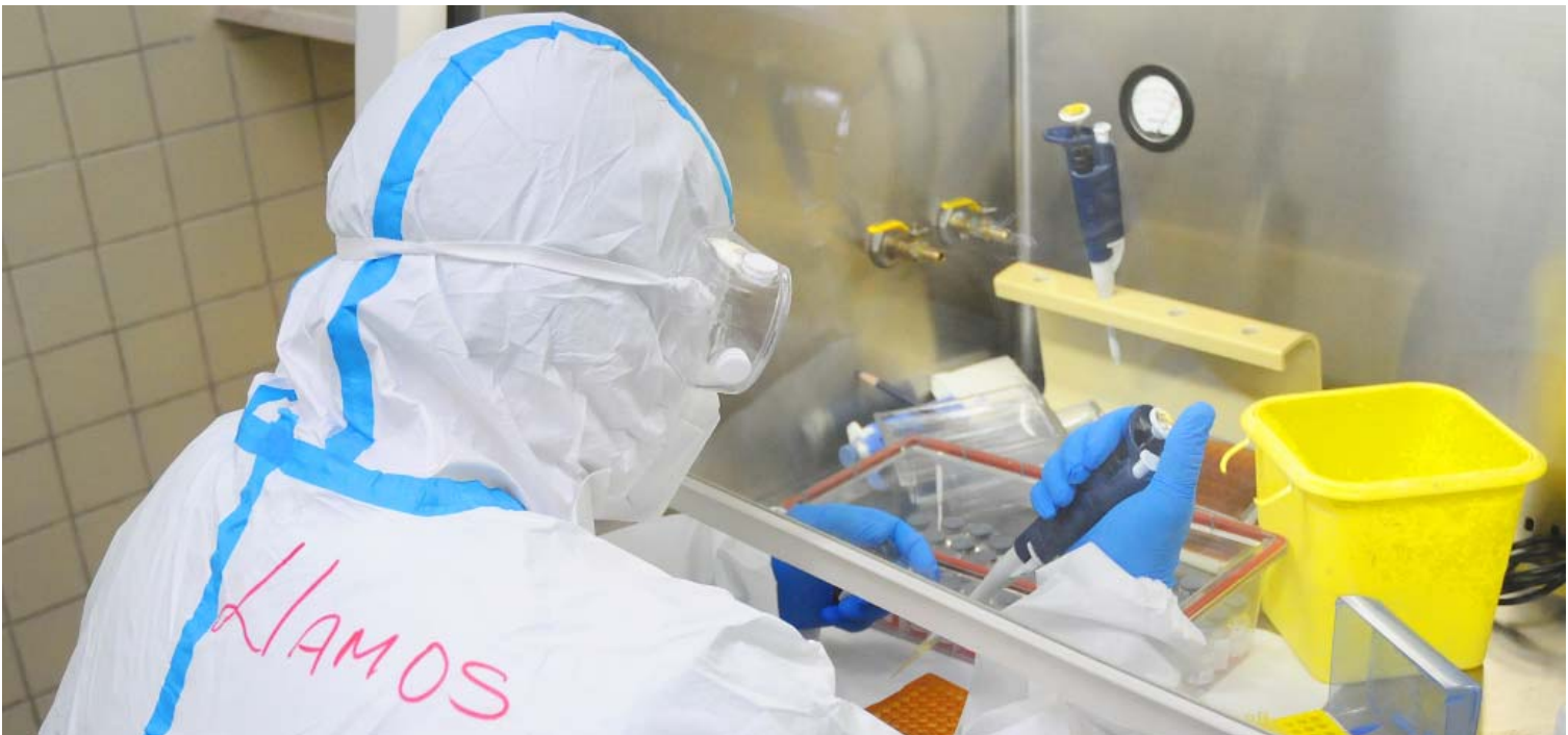
En julio hubo jornadas con más de 2 mil muestras a examinar, cuando la capacidad es de unas 500 diarias.