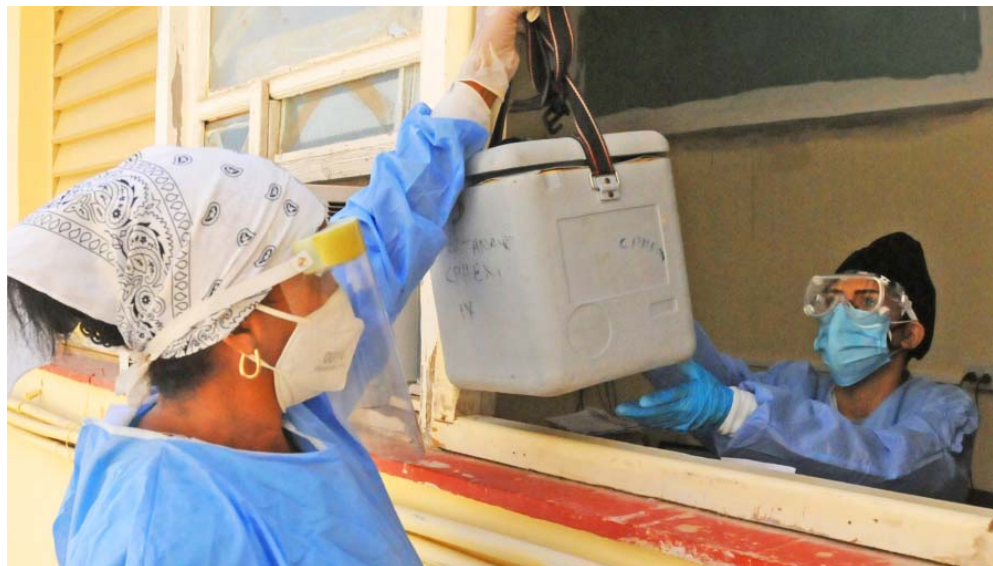
Los laboratorios SUMA y de Biología Molecular se complementan y reciben muestras de todos los municipios.