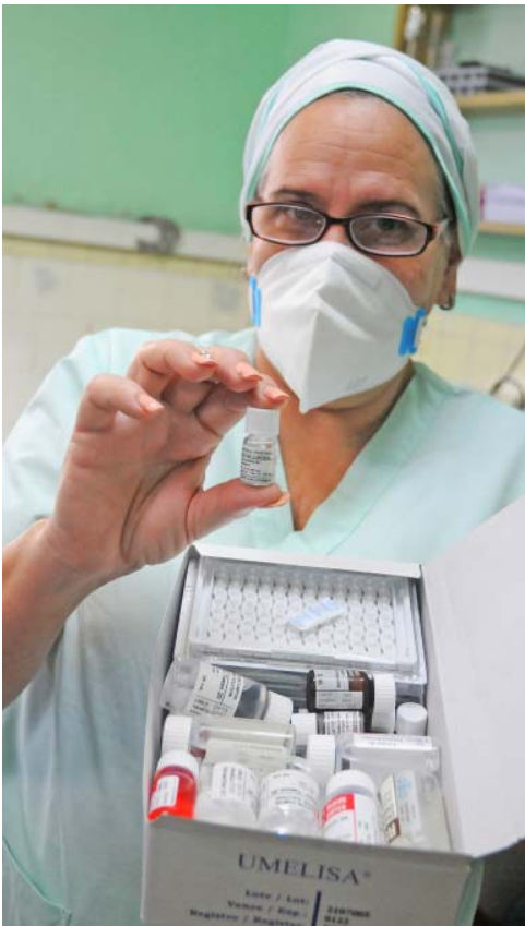
Diagnosticador Umelisa SARS CoV-2 Antígeno que recientemente se comenzó a utilizar en la provincia para la detección del virus.

julio el nuevo diagnosticador Umelisa SARS CoV-2 Antígeno, de producción ciento por ciento cubano, que garantiza soberanía del país en la detección de la enfermedad, y cuya especificidad clínica en los ensayos fue de 97 por ciento.