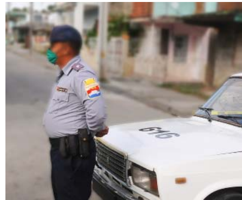
En las arterias principales actuarán autoridades e inspectores para controlar el cumplimiento de las medidas de circulación.

La restricción de movimiento peatonal será a partir de las 2:00 pm. Se exceptúan los casos por causas bien justificadas.