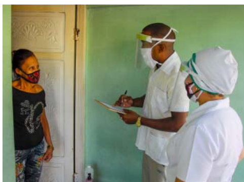
La visita a pacientes en ingreso domiciliario y vigilancia epidemiológica en el hogar entre las medidas fundamentales.

11- Las visitas a los municipios deberán prorrogarse hasta que las condiciones lo permitan. Se autorizarán aquellas con causas previamente consultadas y aprobadas por los grupos temporales.