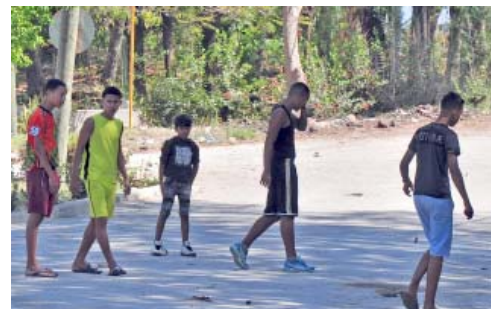
Aumentarán las acciones de prevención y enfrentamiento para detectar a menores y jóvenes que violen las medidas de restricción, y sus representantes legales responderán a las medidas jurídico-penales correspondientes por tales indisciplinas.

5- Se incrementará el servicio de vigilancia y patrullaje, así como la llamada de urgencia a través del 106, para denunciar infracciones a lo estipulado.