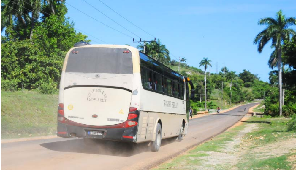
Cinco mil toneladas de mezcla asfáltica se verterán este año en el vial, las cuales beneficiarán unos cinco kilómetros.

“La vía -evaluó- tiene daños, por desgaste en el pavimento flexible, y en el rígido, deficiencias superficiales propias del hormigón hidráulico; existen baches y pérdida de la capa asfáltica caliente o de la penetración invertida, y está incompleta