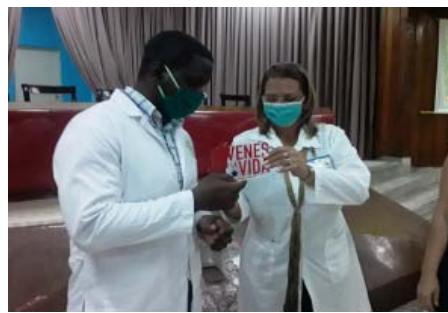
El Hospital General Docente Doctor Agostinho Neto fue uno de los centros reconocidos.