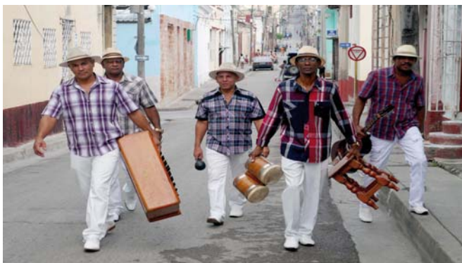
Este año, el grupo Changüí obtuvo entre los reconocimientos la nominación al Guamo, máximo lauro de la Uneac, en este territorio.