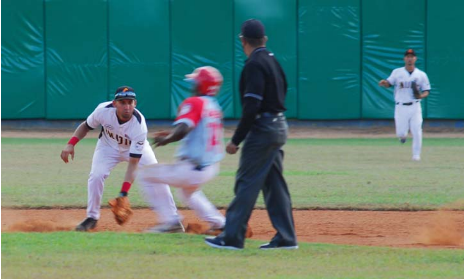
Guantánamo tiene la segunda mejor defensa de lo que va de campeonato, con solo 19 errores en los primeros 28 juegos.

Más allá del dolor de perder, en el deporte también influye la forma, y de las primeras 18 caídas en el campeonato los guantanameros solo han dejado de marcar en una, y en seis han logrado pisar el home plate en cinco o más ocasiones, lo que muestra, a las claras, que el principal problema no es ofensivo. El lado más débil de los Indios es el cuerpo de lanzadores, al que le batean para 302 de average, y ha permitido 184 carreras limpias para un promedio de