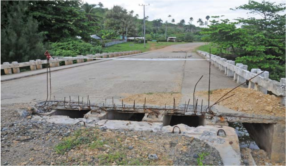
La inversión incluye reparar, modificar o construir 25 puentes.

la estructura del derivado del petróleo, además de observarse otras afectaciones por la ejecución de obras ajenas en la vía o su entorno”.