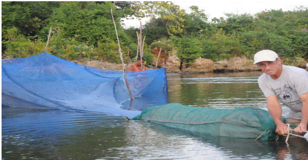
Juan y su tropa, con el inicio de la fase lunar Cuarto Menguante, montan el “miliciano”. La experiencia de 20 años le indica el curso exacto del cardumen.

profundidades superiores a los 500 metros se aparean y cada ejemplar deposita hasta nueve millones de huevos, tras lo cual mueren.