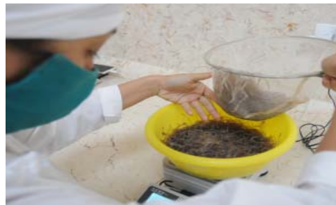
Centro de beneficio: garantía de selección, conservación, vitalidad y reconocido estándar de calidad para las exportaciones.

Así y refrigerados a temperaturas de 11 a 14 grados centígrados los alevines reducen su metabolismo, limpian el tracto digestivo y mantienen su vitalidad, factores exigidos por el cliente en Canadá, a donde se dirigen esas partidas de Baracoa que, en el futuro, ampliará las capturas a los estuarios de Mata y Camarones, en su apuesta por abrir La Primada, mucho más, al mercado internacional.