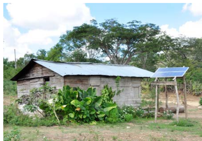
Los nuevos sistemas fotovoltaicos a instalar superan en capacidad a los que actualmente electrifican a 3 mil 953 viviendas rurales guantanameras.