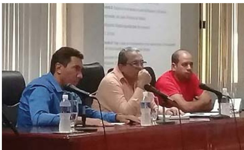
El ministro del ramo (a la izquierda) reconoció las inventivas que realizan los guantanameros para sostener la transportación.

Insistió en el control a los medios paralizados por dificultades técnicas y los que están en arrendamiento, para evitar ilegalidades en esas áreas, y aclaró que es responsabilidad de Transporte dejar claro en el contrato a los cuentapropistas arrendatarios cuáles deben ser las prioridades a la hora de explotar cada medio (ya sea para el movimiento