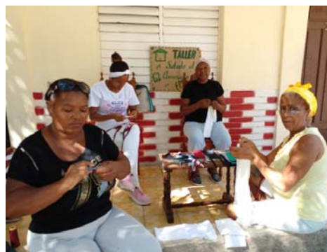
Algunas de las federadas que integran el Taller de manualidades.

"Mi mayor orgullo", ser parte de la organización que ha dado voz y esperanzas a las mujeres cubanas, que llama a la unidad, al empoderamiento femenino y, sobre todo, a seguir las ideas de Vilma Espín Guillois, nuestra histórica líder.