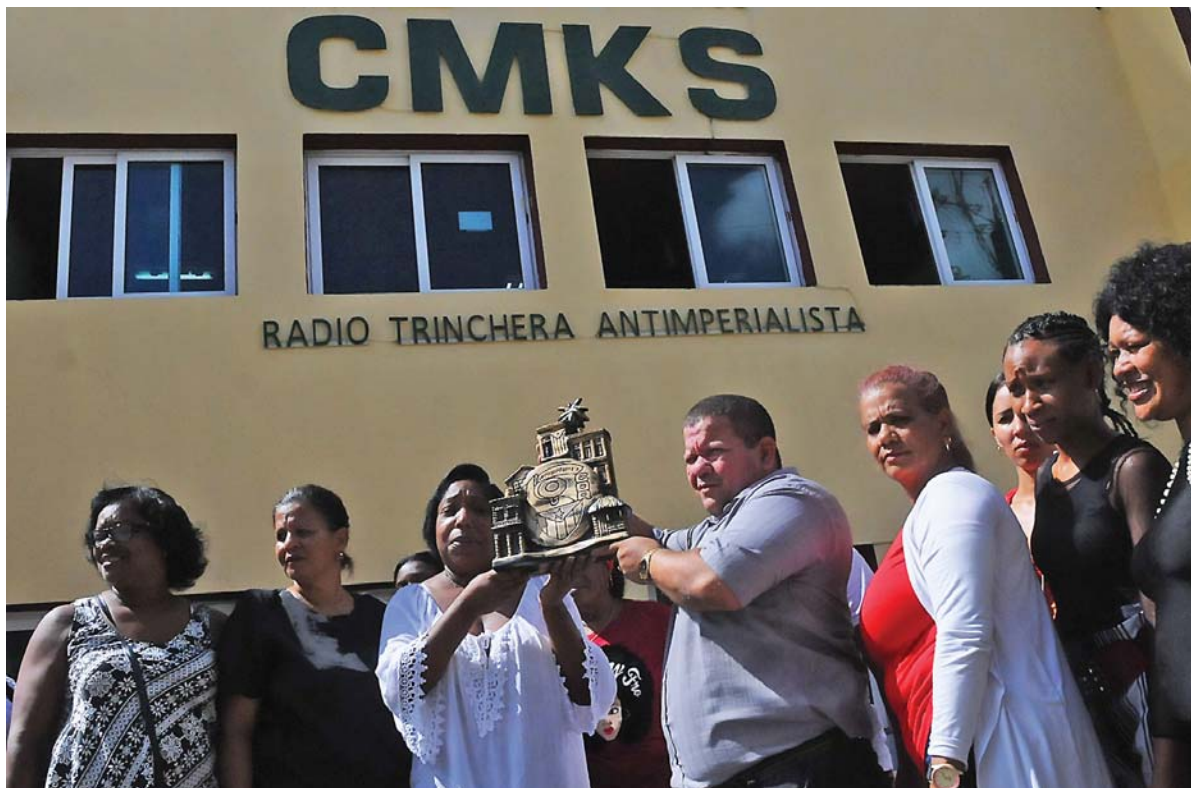
La emisora CMKS es el primer medio de prensa en Guantánamo en recibir el Premio del Barrio.

Significó que la planta radial es el reflejo del quehacer de los