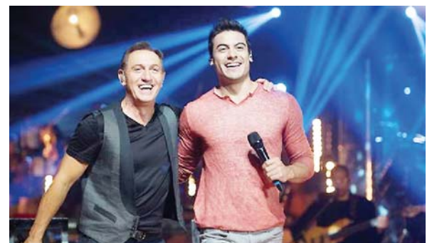
Rivera ha compartido escenario con célebres artistas exponentes de la música hispana, como Franco de Vita.