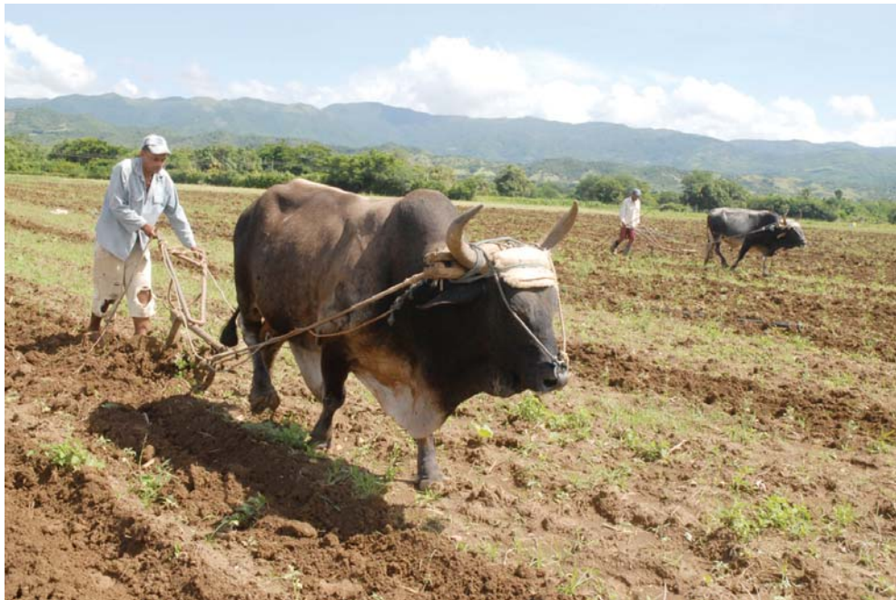
La Ley de Tierras es básica para organizar la actividad agropecuaria en el país.

La Ley de Tierras vendría, pues a desarrollar y explicar cómo se cumplen estos preceptos constitucionales de gobernanza responsable de cada terruño, a tono con los convenios internacionales sobre posesión, uso y acceso a la tierra y bienes agropecuarios: la Agenda de 2030 para el Desarrollo