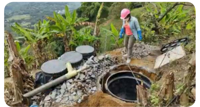
En la gráfica, uno de los proyectos de Young Water Solutions (autor de la foto) en América Latina para el beneficio agrícola y comunitario.

Mencionó también las zanjas de filtración, surcos longitudinales en la tierra que captan el agua de llu-