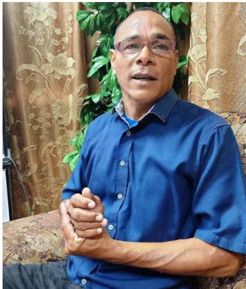
"Según la Ley de Procesamiento Penal, cuando la Policía recibe la denuncia, debe practicar inmediatamente las diligencias indispensables o sea, investigar, identificar a la persona denunciada, ocupación de bienes que fueron parte de la comisión, inspección del lugar...", precisa el fiscal.

"Hablamos varias veces. Un día me llamó para anunciar que se haría la transferencia, y como a los 15 minutos recibí un mensaje de WhatsApp donde me de-