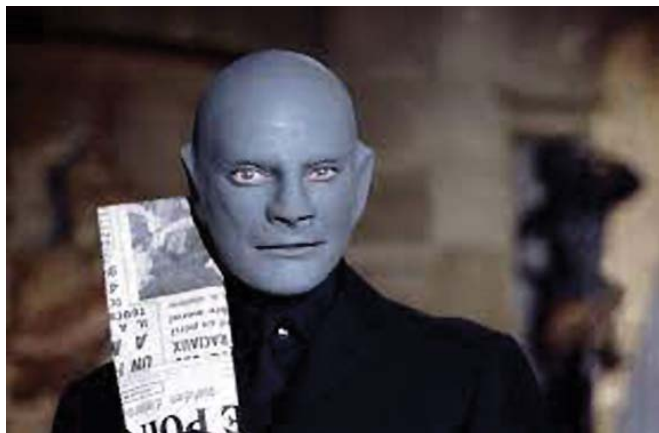
Fotograma del taquillero filme francés.

La peña Ojo Crítico , por su parte, expondrá los largometrajes norteamericanos Asteroid City , comedia del año en curso, dirigida por Wes Anderson y protagonizada por Scarlett Johanson, Tom Hanks y Margot Robbie, y Hillbilly, una elegía rural , drama del 2020, con dirección de Ron Howard, los lunes 21 y 28 respectivamente, siempre