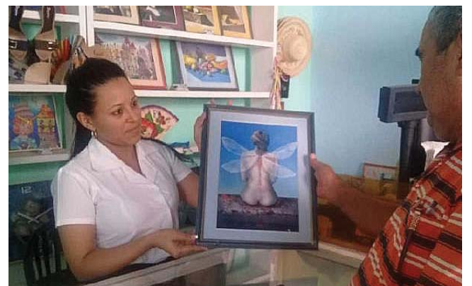
Artex va por más tanto en ofertas culturales como en promoción y calidad del producto artístico.

Las ofertas culturales muestran el trabajo de Artex por lograr variación en la programación, teniendo en cuenta la heterogeneidad de la población guantanamera.