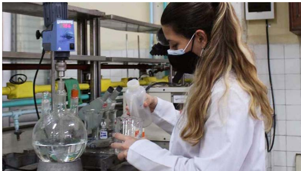
La adquisición de reactivos para el trabajo de los laboratorios es de los obstáculos que pone el bloqueo al proceso de formación profesional en la Enseñanza Universitaria.

Precisa el documento que la carencia de mobiliario escolar es de las mayores afectaciones al proceso docente-educativo,