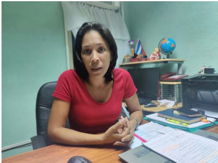
Mendoza Velázquez: “La responsabilidad primera en el Control Interno es de las administraciones”.

Diez días después entramos en la fase de ejecución, la más significativa y en la que aún estamos. Lo que hacemos es profundizar en esos riesgos, e identificar los hallazgos, que es como se define