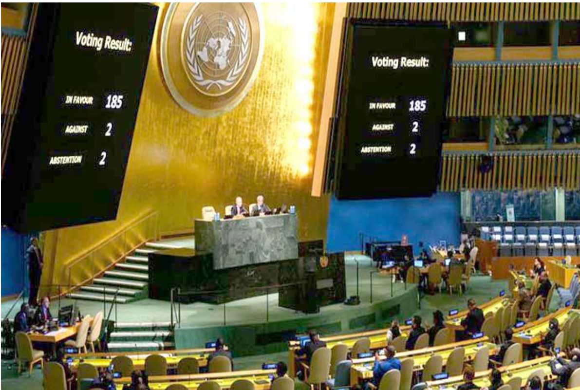
Resultados de las votaciones en 2022.

1994: A favor, 101; en contra, dos; abstenciones, 48; ausencias,