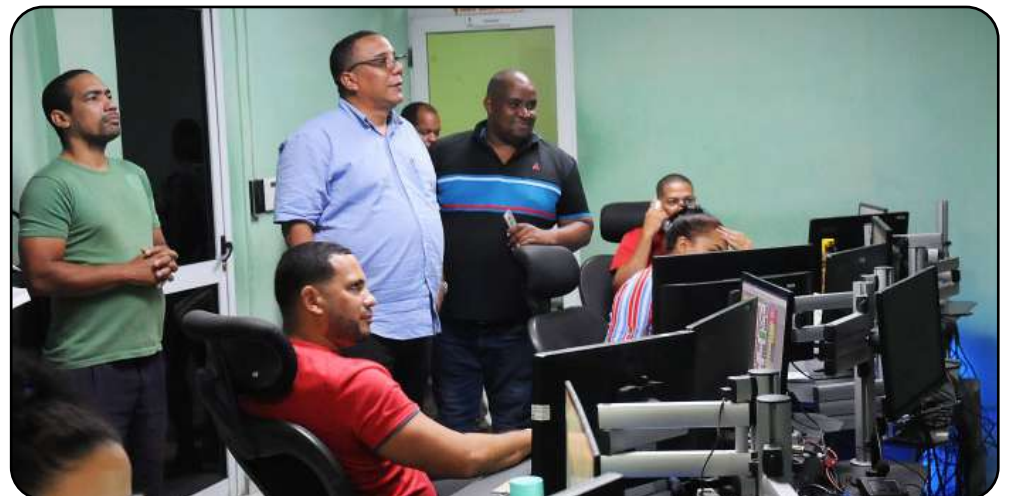
En el despacho central de la Empresa Eléctrica, el Primer Secretario agradeció a los trabajadores su esfuerzo.