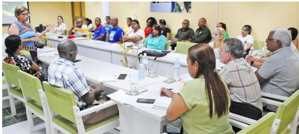
El encuentro reunió a la Comisión de prevención y enfrentamiento a las drogas en Guantánamo.

Expertos jurídicos indicaron que juzgaron a 43 personas y se sancionó a todos los comprometidos, prevaleciendo la imposición de la sanción de privación de libertad; tres de los implicados recibieron sanción alternativa, pues no superaban los 18 años de edad y eran es-