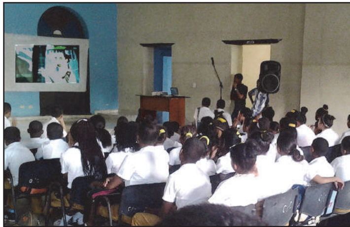
Cine Andante contribuye a la formación de la cultura audiovisual en los públicos.

El realizador lo resume en una idea clara: "Mientras existan comunidades que esperen el cine como una visita necesaria, Cine Andante seguirá andando. Porque hacer cultura, aun en tiempos difíciles, es también un acto de justicia".