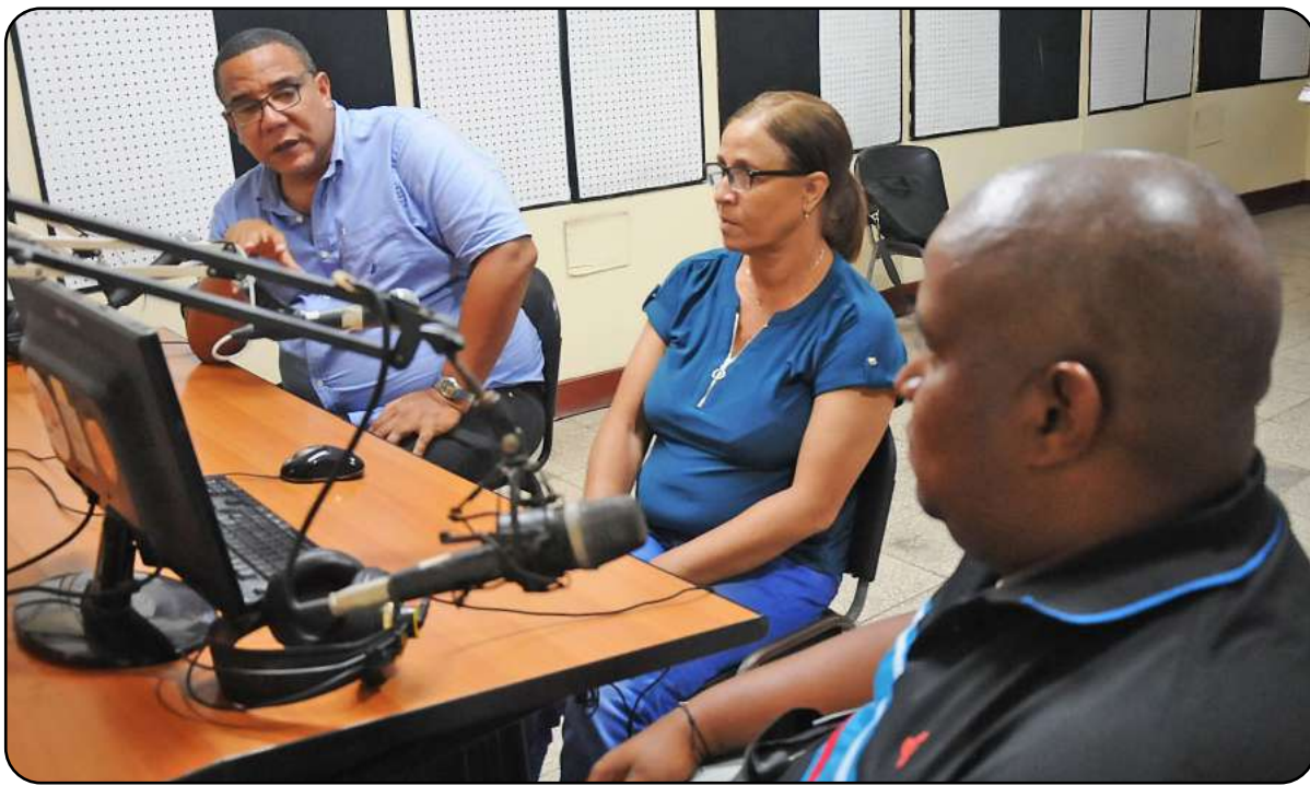
Las máximas autoridades de la provincia, desde la radio, mantuvieron informada a la población

● Ariel SOLER C. y Dairon MARTÍNEZ TEJEDA