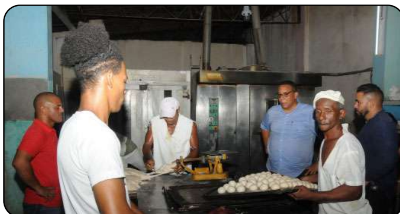
Las panaderías estuvieron entre las primeras instituciones protegidas en la recuperación del Sistema Eléctrico.