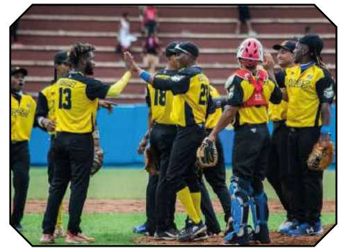
Guantánamo dio primero ante los cazadores artemiseños.

Para el este partido, la novena del Guaso la conformaban, en los jardines