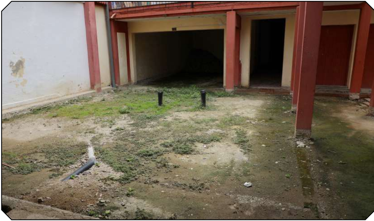
El patio de la Casa del Joven Creador ya muestra la maleza abriéndose paso entre la construcción inacabada.

● El deterioro de la Casa del Joven Creador constituye una problemática que afecta el estado del arte producido por ese segmento y su consumo