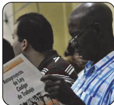
Juristas, diputados a la Asamblea Nacional, representantes del Partido, el Gobierno y organizaciones de masas acompañan a los trabajadores en la discusión del texto artículo por artículo.

En palabras de la dirigente sindical, cada criterio cuenta: desde el más técnico hasta el más cotidiano, porque el objetivo final es que la nueva ley nazca del consenso y refleje artículo por artículo, la realidad de los trabajadores de hoy.