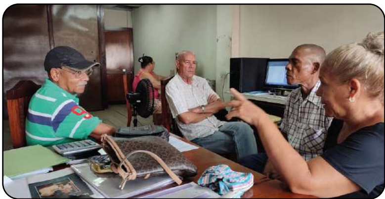
El colectivo de la editorial retoma el sutil olor a libro nuevo.

Llegar a la Editorial El Mar y la Montaña , sentir el olor a libro nuevo y el ruido de la máquina de impresión ríson, es la mayor satisfacción de cada uno de los trabajadores de ese centro.