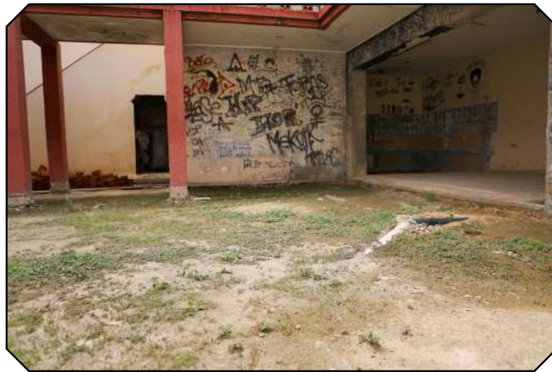
Los grafitis que alguna vez "animaron" las peñas, hoy desaparecen bajo el polvo.