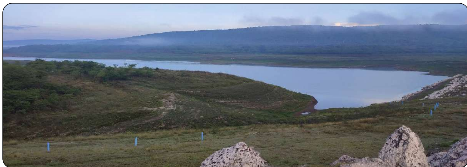
La Yaya, mayor presa de la provincia, con 11 millones de metros cúbicos (160 millones de capacidad) amenaza seriamente con secarse, pero aún así no faltará el agua a los guantanameros.

Tenemos, además, fuentes secas, 10 estaciones de bombeo paradas por problemas tecnológicos y cortes de electricidad que conspiran contra el abasto.