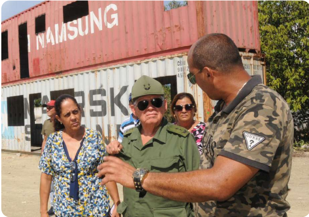
El General de División visitó el emplazamiento donde se monta la experiencia de fabricación de casas para damnificados a partir de contenedores.

El General de División Ramón Pardo Guerra, jefe del Estado Mayor Nacional de la Defensa Civil, chequeó durante tres días, en Guantánamo, los planes y las medidas para la reducción de desastres, con énfasis en las acciones para mitigar los efectos de la sequía que afecta a la más oriental de las provincias cubanas.