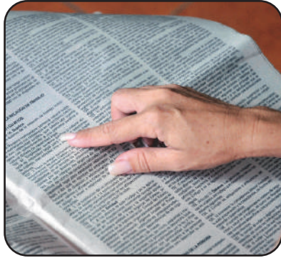
Para garantizar la mayor preparación, se distribuyeron tabloides impresos con el anteproyecto.

En la provincia, se prevén mil 740 encuentros, que comenzaron el pasado 8 de septiembre, con una reunión piloto en el colectivo de la Fiscalía pro-