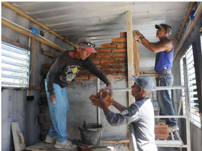
Por el momento se avanza en las instalaciones internas y divisiones.