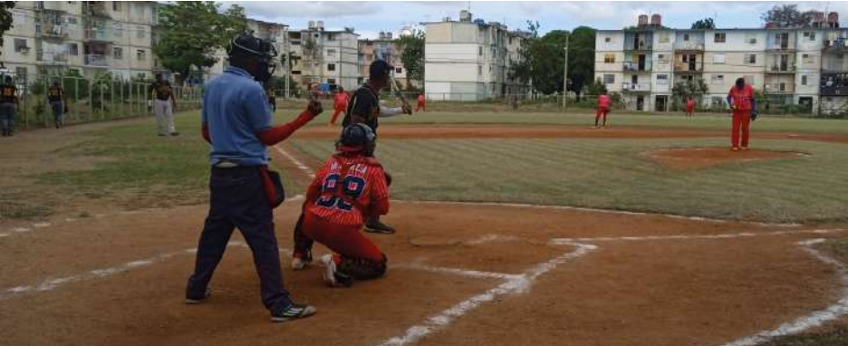
Jamaquinos (al campo) buscará ratificar el título.