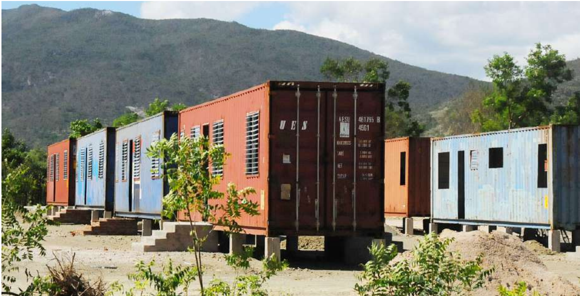
Las casas deben entregarse a mediados de diciembre.