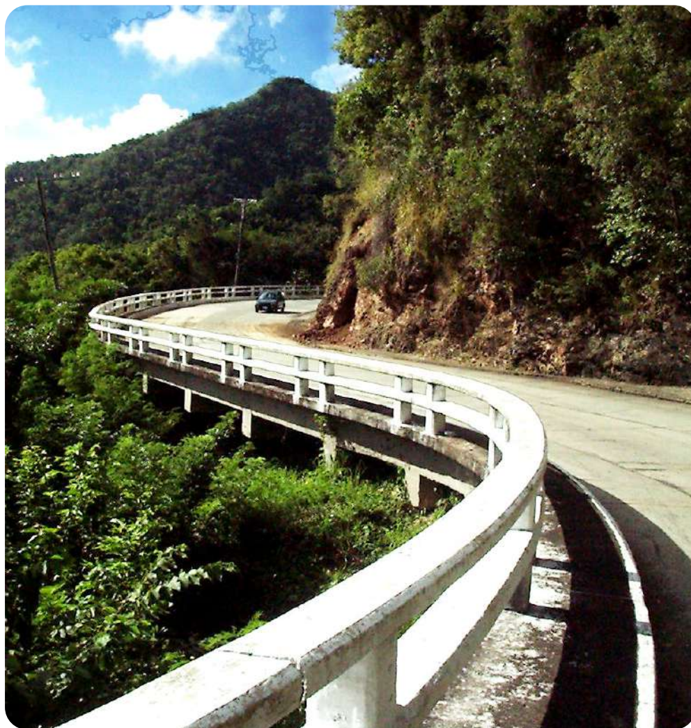
Una de las siete maravillas de la ingeniería civil cubana.

“Las condiciones del terreno eran muy difíciles, por las pendientes, el abismo, las lluvias, los derrumbes y la estrechez para el desplazamiento de los vehículos”, afirmó por su parte Santiago Daissón, entrevistado por este reporte-