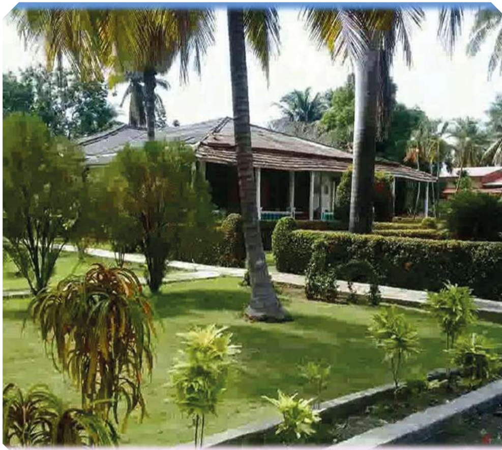
Vista de la Facultad universitaria del Partido Israel Reyes Zayas, en Guantánamo.

a las disímiles y más complejas tareas de la Revolución; su contribución fue decisiva en muchas de ellas como la Campaña de Alfabetización, las zafras del pueblo, la Lucha contra bandidos, las movilizaciones a planes productivos, constructivos, educacionales, culturales, defensivos, entre otros; estimulados por la visión de Fidel: "Se enseña haciendo y se hace enseñando".