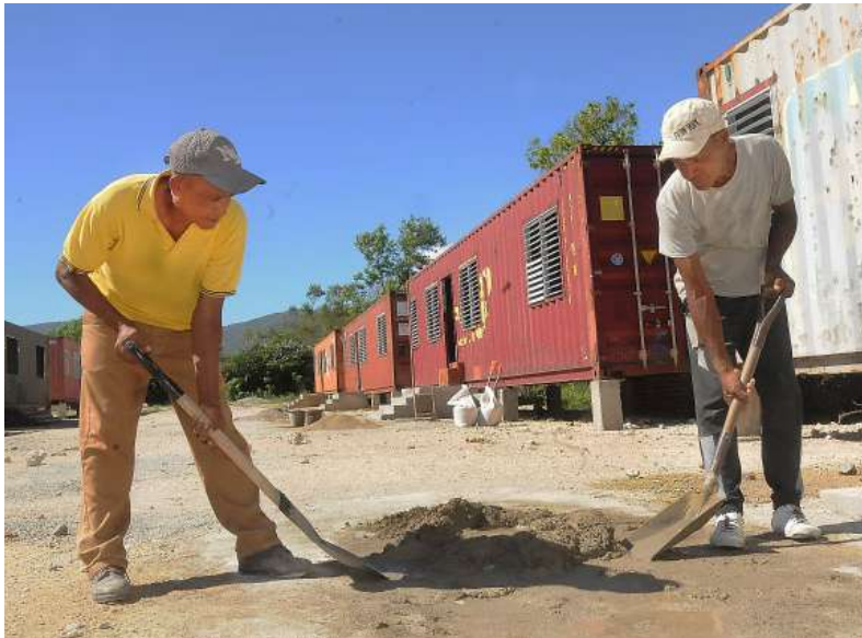
Brigadas de varios municipios colaboran para terminar con prontitud la obra.