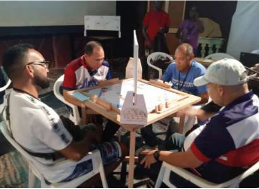
Olbis (extremo izquierdo) venció en la modalidad individual.

Desde el punto de vista competitivo el Clásico del Guaso 2025 fue otro gran torneo, pero lastimosamente adoleció del apoyo institucional, lo que provocó que ni