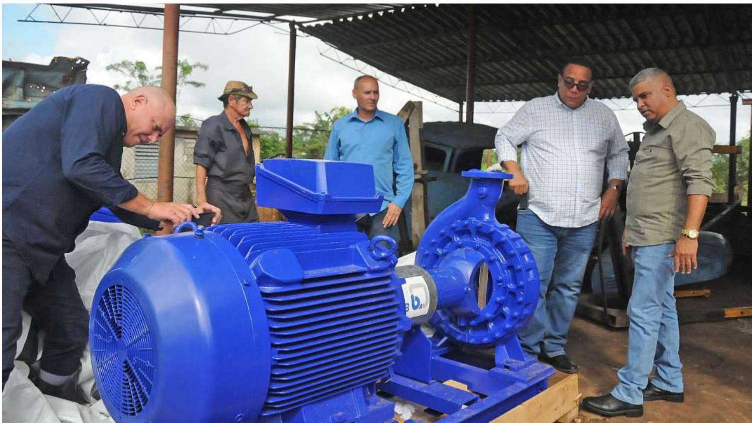
Nuevas electrobombas serán montadas en Maisí.

El campesino le informó de los resultados satisfactorios de las primeras cosechas y la estrategia de siembra para la campaña de frío en desarrollo, que incluye cultivos como yuca, boniato, malanga