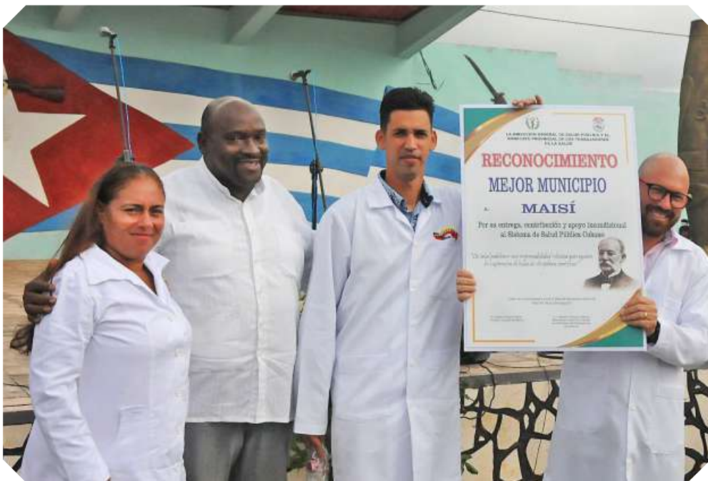
Reconocimiento a Maisí como municipio más destacado en 2025.

gratulado por su incansable labor para garantizar la salud del pueblo antes, durante y en la etapa de recuperación de las afectaciones provocadas por el huracán Melissa.