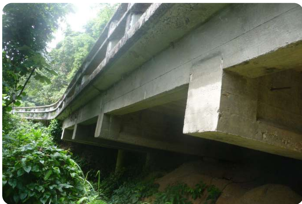
Ingeniosidad en las soluciones técnicas. Obsérvense los gruesos pilotes encajados sobre la roca y las vigas de hormigón de alta resistencia, donde descansa la placa volada sobre el precipicio.

A partir de ese estudio se proyectarían las acciones a realizar, algunas de ellas complejas, por la magnitud de los daños, lo escarpado del terreno y los medios técnicos exigidos. Por lo pronto se sustituyeron losas dañadas en varios tramos y se trabaja en la rehabilitación de otros, como el de Cagüeybaje, para que La Farola siga irradiando luz.