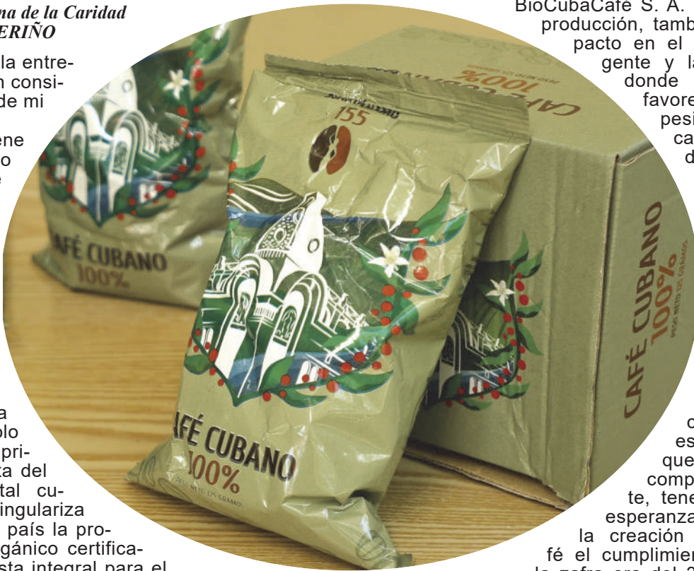
Café 155 Aniversario Guantánamo, homenaje al Título de Villa de la urbe del Guaso. El producto evoca la riqueza natural y cultural del territorio extremo oriental cubano.

BioCubaCafé S. A. no se limita a la producción, también tiene un impacto en el desarrollo de la gente y las comunidades donde trabaja, incluso, favoreciendo al campesino de las zonas cafetaleras afectadas por eventos meteorológicos. El apoyo de la empresa ha sido vital para que no decaiga la producción.