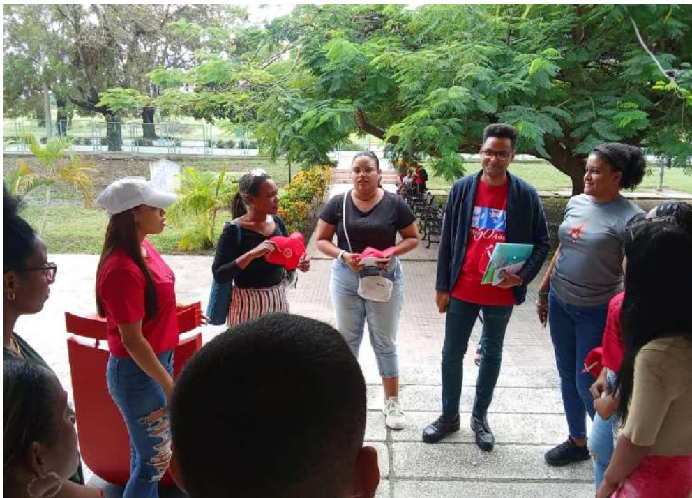
Integrantes de la expedición Mis manos por Cuba .