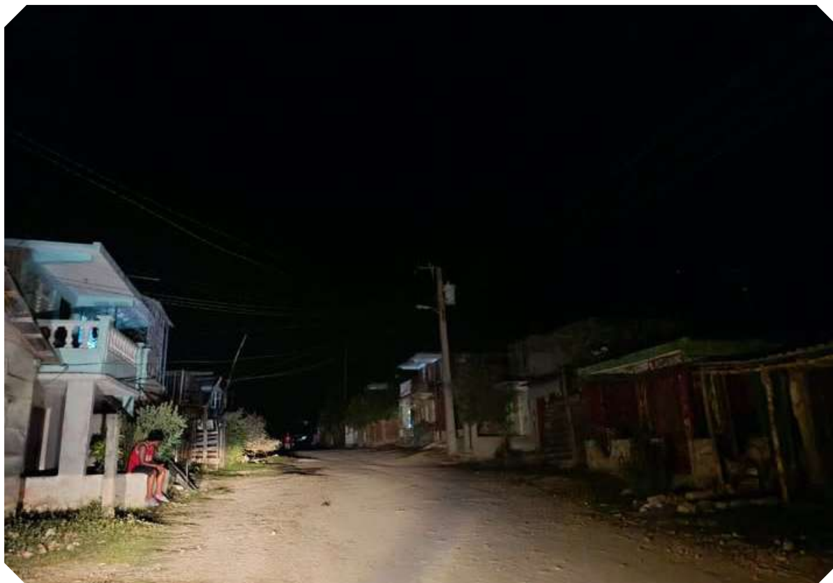
La contingencia energética imposibilita planificar horarios de apagones, de ahí la incertidumbre popular para realizar sus tareas domésticas.

Nuestro trabajo es gestionar esta crisis con el máximo rigor técnico y con la prioridad absoluta puesta en proteger los servicios esenciales y la vida de los más vulnerables.