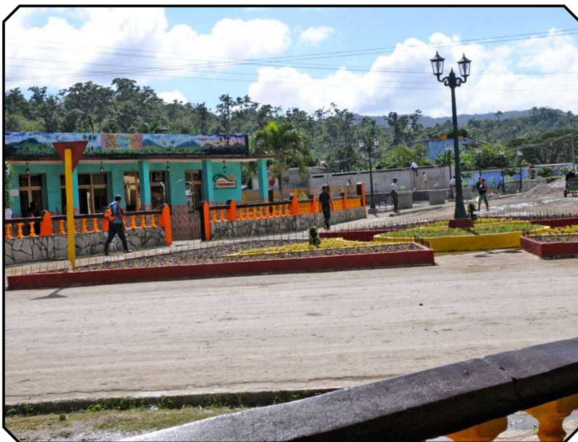
Palenque, capital de la serrana Yateras, se alista para la gran celebración.

Un ambiente de júbilo popular que impulsa la construcción de obras en el sector social y económico-productivo se percibe en el municipio de Yateras, sede del acto provincial por el 67 aniversario del triunfo de la Revolución Cubana.