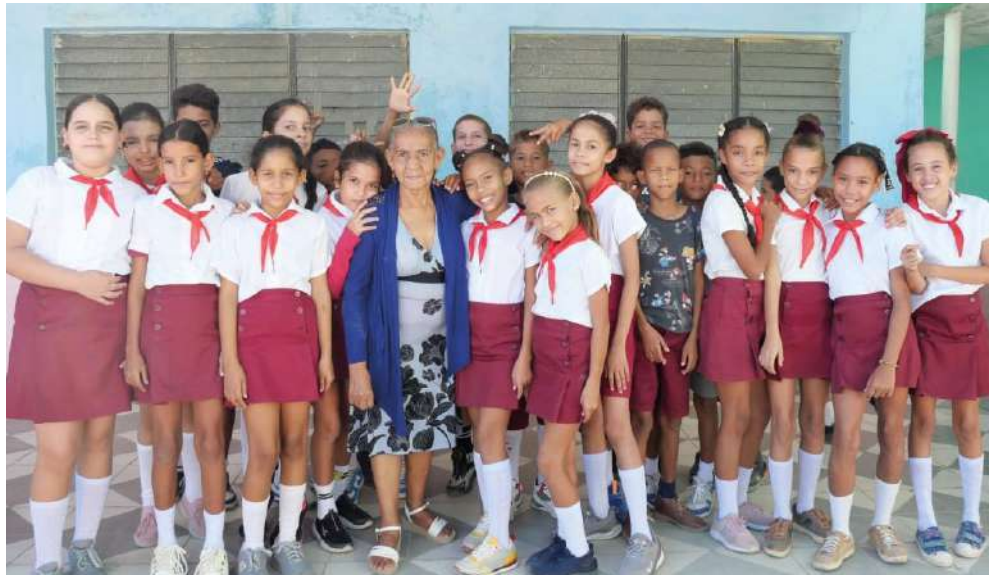
La maestra es un ejemplo para sus alumnos, que la quieren como si fuese parte de su familia.

“Una vez maestra... maestra para siempre”.