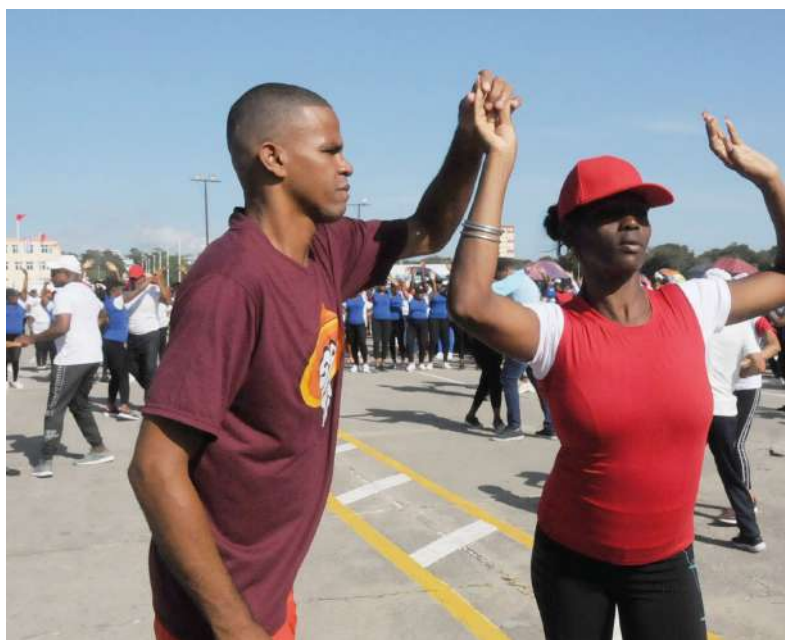
Guantánamo se inserta en el movimiento nacional de ruedas de casino.