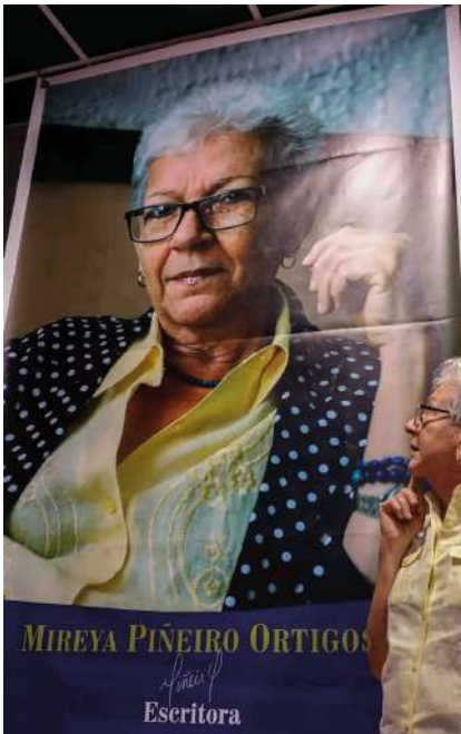
La poetisa fue homenajeada en la Feria del Libro.