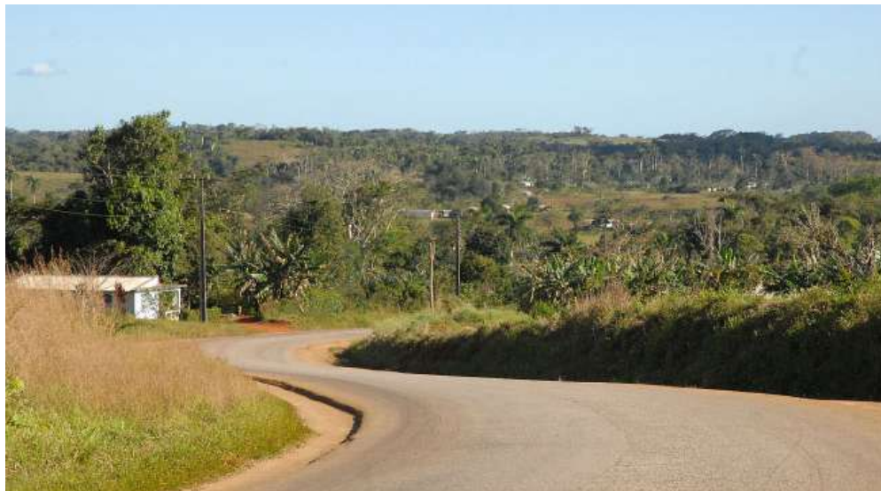
Este mes deben iniciar las reparaciones del vial central, y aunque las labores no concluirán este año, garantizarán mejoras considerables en la transitabilidad del municipio.