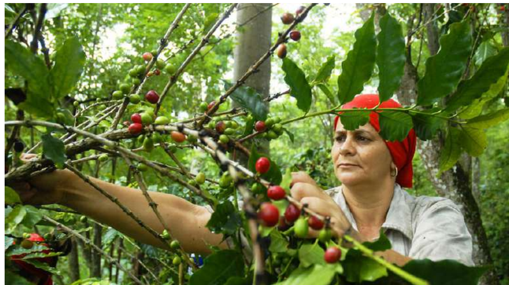
El cultivo del café fue duramente afectado por eventos meteorológicos durante 2025.

“En Yateras no hay empresas con pérdidas; la Empresa Agroforestal, tras un quebranto de 23 millones por los fenómenos meteorológicos, se recupera y ya decreció más de 11 millones; el Comercio y la Empresa Alimentaria cumplen sus planes por encima del ciento por ciento”, puntualiza.