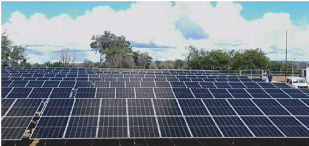
Este año serán dos los parques fotovoltaicos construidos en la provincia, ya uno está sincronizado al Sistema Electroenergético Nacional.

“Por eso, la transición energética sigue siendo uno de los mayores retos para 2026. Nuestro principal objetivo será desarrollar fuentes de energía renovables, y que cada municipio pueda gestionar su propia energía. Promovemos la venta de paneles solares a trabajadores de sectores clave como la Salud y la Educación, lo que aliviará el Sistema Energético y permitirá a estas familias contar con fuente estable de energía”, asegura.