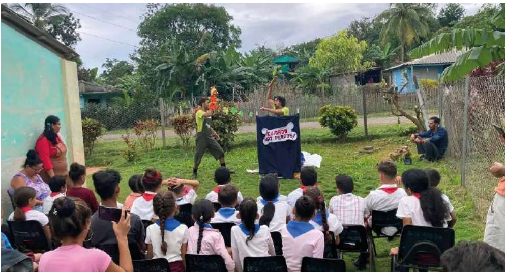
Cruzada Teatral Guantánamo-Baracoa.