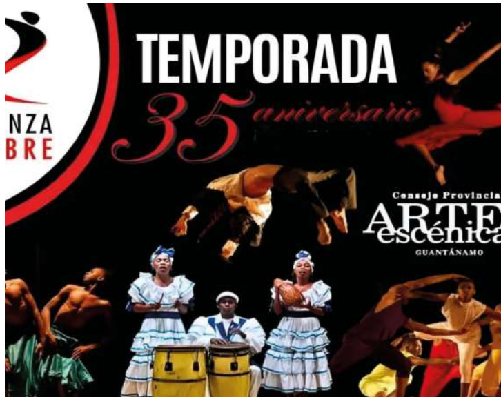
Durante el año, la danza guantanamera festejó aniversario del movimiento profesional.

Las dificultades económicas no son justificación para la desorganización, la falta de calidad artística, ni el respeto a los horarios para realizar cualquier actividad. Debemos seguir apostando por hacer, pero hacer bien las cosas en un país que necesita más que nunca defender nuestra cultura.