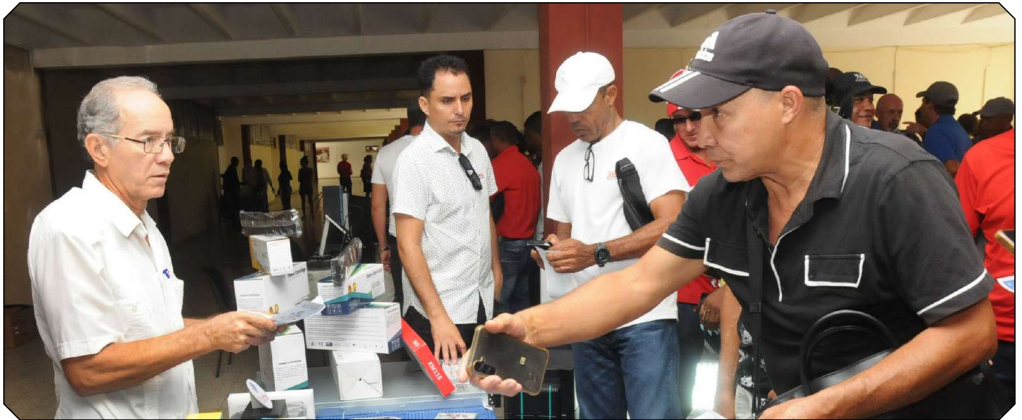
Los participantes estuvieron prestos a concertar contratos y negociar créditos para avanzar en la transformación de la matriz energética de la provincia de Guantánamo.

La Universidad de Guantánamo (UG) acogió esta semana la primera ronda de negocios de energías renovables, para impulsar el uso de estas tecnologías por una veintena de entidades estatales y privadas como alternativa para sortear las limitaciones derivadas de la crisis energética que afecta al país debido al recrudecimiento del bloqueo económico, comercial y financiero del Gobierno de los Estados Unidos, y hostiles medidas de la administración Trump como el cerco energético a la Isla.