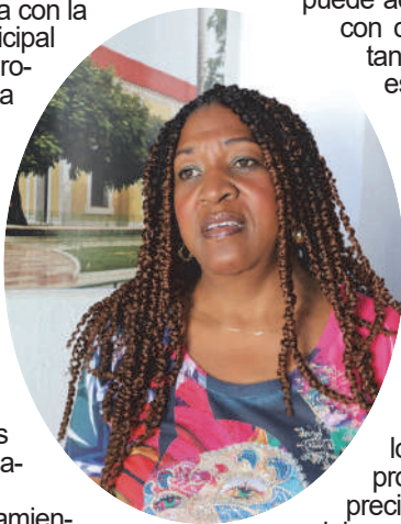
Regla apunta que priorizan proyectos que cuenten con fuentes renovables de energía.

Para no hacer el cuento largo, los PDL en Guantánamo sí representan una idea interesante para activar recursos propios en medio de una crisis que se prolonga, pero hay que estar atentos para que su desarrollo no choque con los obstáculos de siempre: inestabilidad, descontrol..., sobre todo, en el caso cubano, condicionado además por un entorno productivo tensionado por las constantes sanciones externas para limitar el progreso aunado a nuestras propias deficiencias.