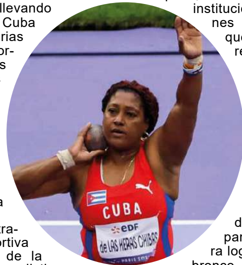
Noraivis recibió el galardón en la Asamblea Solemne correspondiente al pasado año.