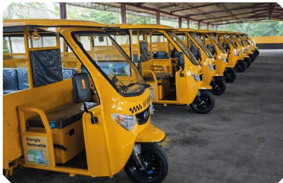
En el transporte, se registran 4 mil 866 vehículos eléctricos.