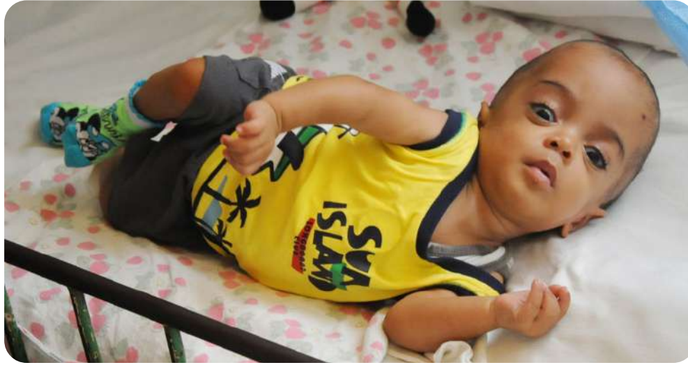
Adabi. Una vida tras la cual hay mucha ciencia y competentes jóvenes profesionales formados por la Revolución.

servador, con medicamentos como monitol y acetazolamida, y en un segundo momento se le realizó un estudio de imagen con neurocirugía, por lo que, junto a sus padres y el médico, es trasladado hacia Las Tunas para la tomografía.