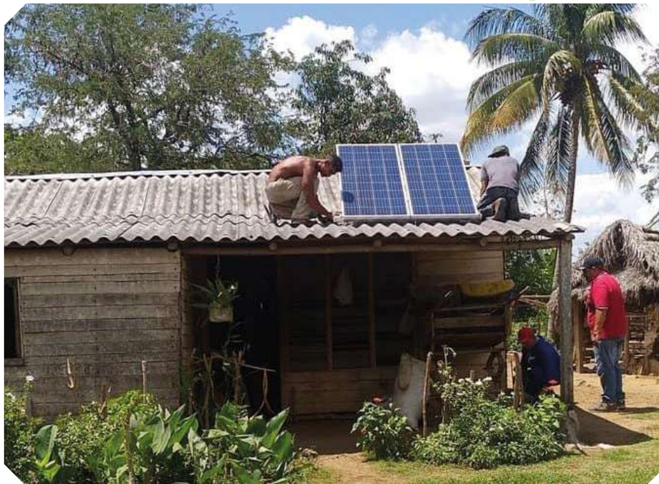
La provincia colocará sistemas completos de 2 kWp en 360 viviendas aisladas.