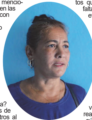
Albis: Tributamos al uno por ciento del desarrollo local, sin impagos.