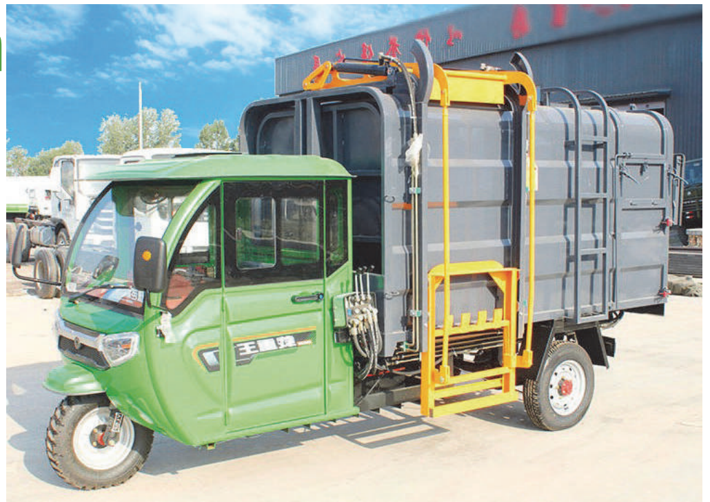
Modelo de vehículo que implementaría el PDL para la recogida de basura.

El 2025 fue el año más productivo de la empresa, con ventas de 2.26 millones de pesos y