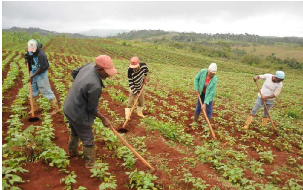
La Clarita, escenario perenne de actividad agrícola.