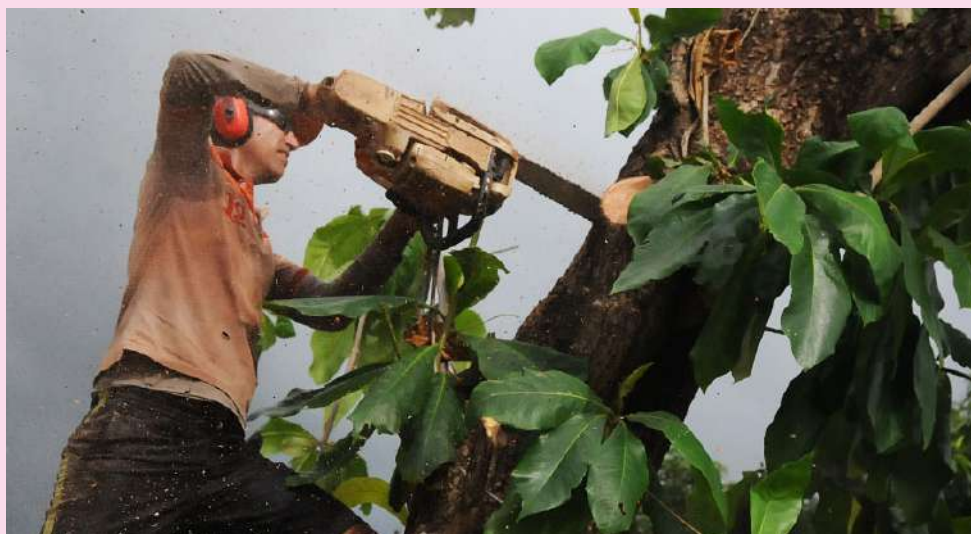
Higienización, recogida de desechos sólidos, limpieza de tragantes y tala de árboles precedieron a la realización hoy del Meteoro 2026.

paso de huracanes que han afectado al territorio; se comprueban los sistemas de aviso y los aseguramientos comunicacionales y las vías y métodos para mantener informada a la población.