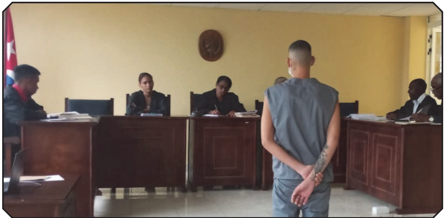
Un momento en la vista oral del referido proceso.

A la tarde siguiente, mientras en un alto de una finca cercana se detuvieron a observar una vivienda conocida y medio solitaria, vieron cómo del matorral emergía un hombre joven con un