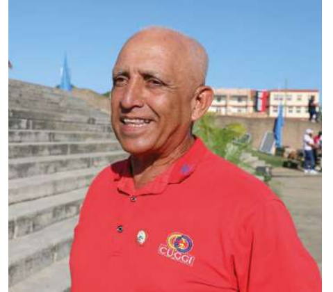
La juventud constituye una fuerza esencial para preservar la independencia y la dignidad de la nación, aseguró Teófilo.

Asimismo, reconoció el papel de los profesores, quienes acompañaron a los jóvenes y contribuyeron al desarrollo exitoso de la Tribuna, que demostró, una vez más, la entrega del pueblo a su Revolución.