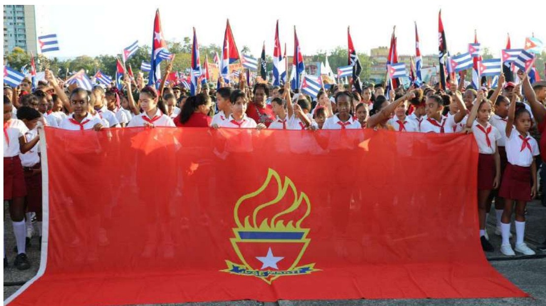
Los pioneros no faltaron en este reclamo por la justicia y la paz para Cuba.