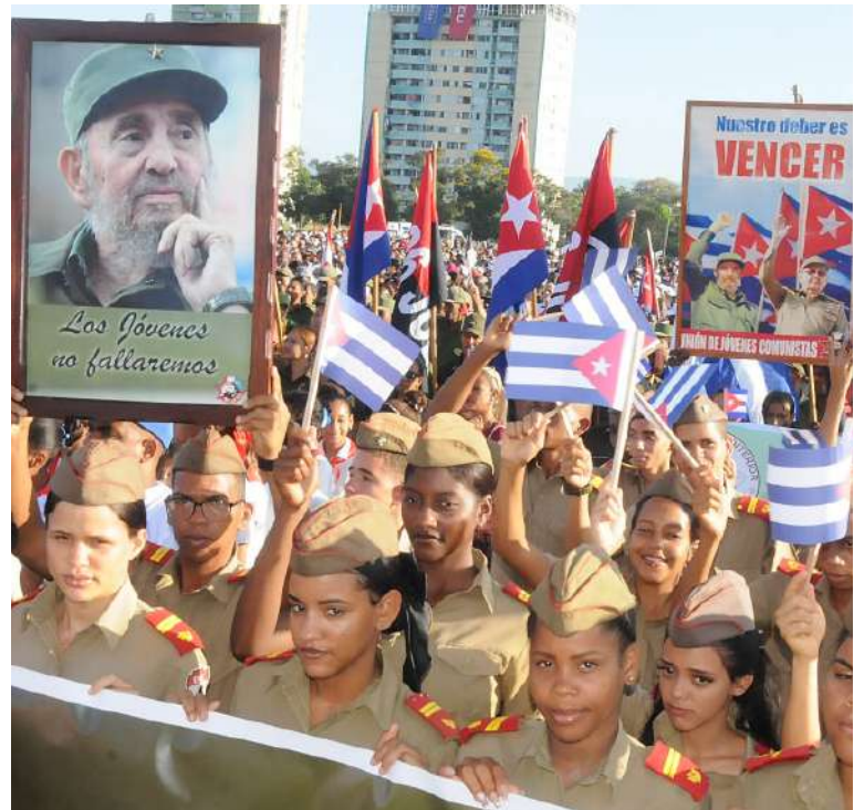
Los Camilitos estuvieron al frente de la Tribuna, en representación de las nuevas generaciones de combatientes.