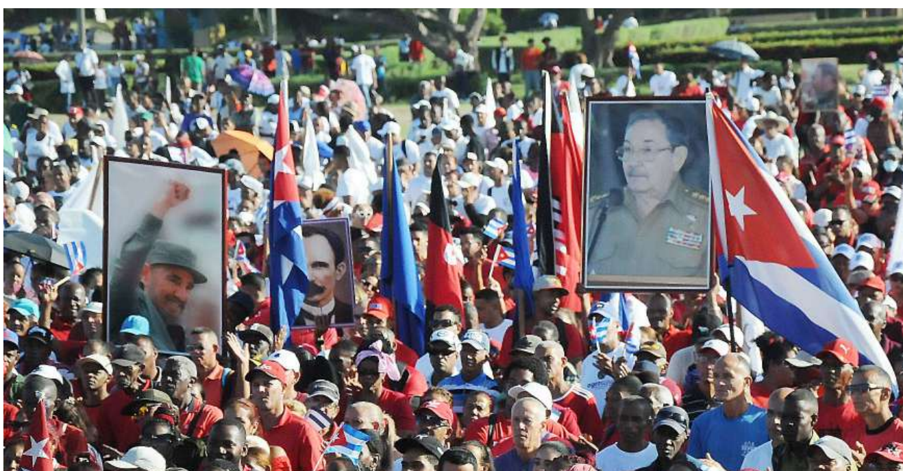
Una vez más, Guantánamo denunció las artimañas del imperialismo.

¡A Cuba se respeta!, proclamaron los guantanameros y aseguraron que el pueblo no cesará en su lucha por la paz y la defensa de la soberanía nacional, un compromiso de los revolucionarios conscientes, hombres y mujeres de Patria o Muerte, ¡Venceremos!