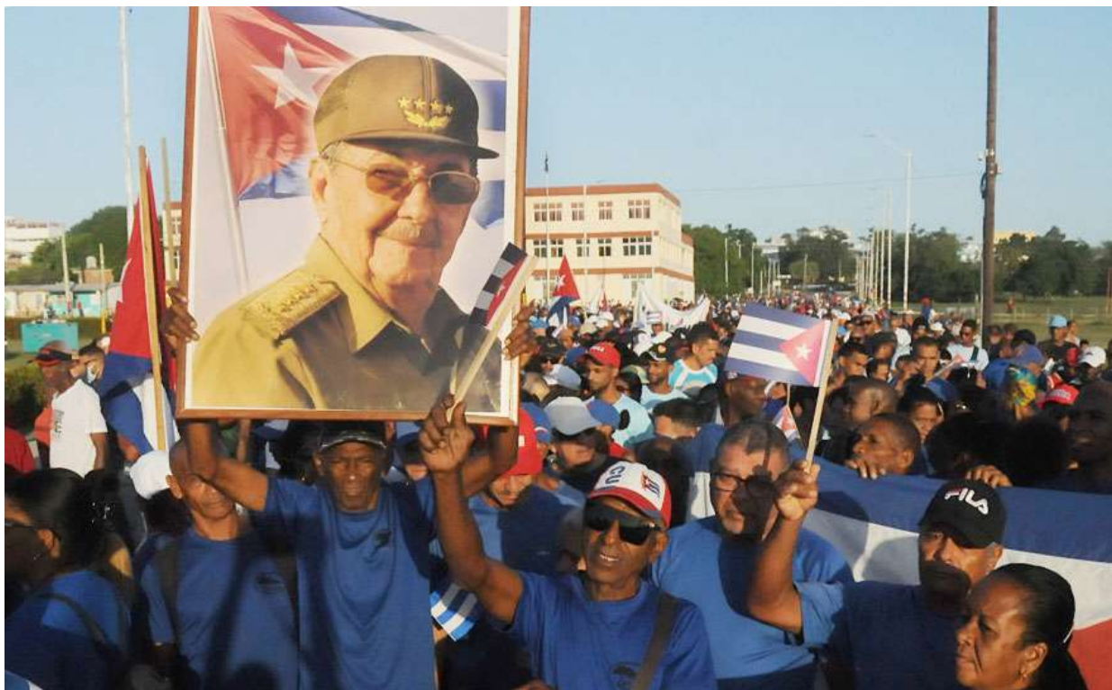
Con Raúl no te metas, afirmaron los guantanameros.