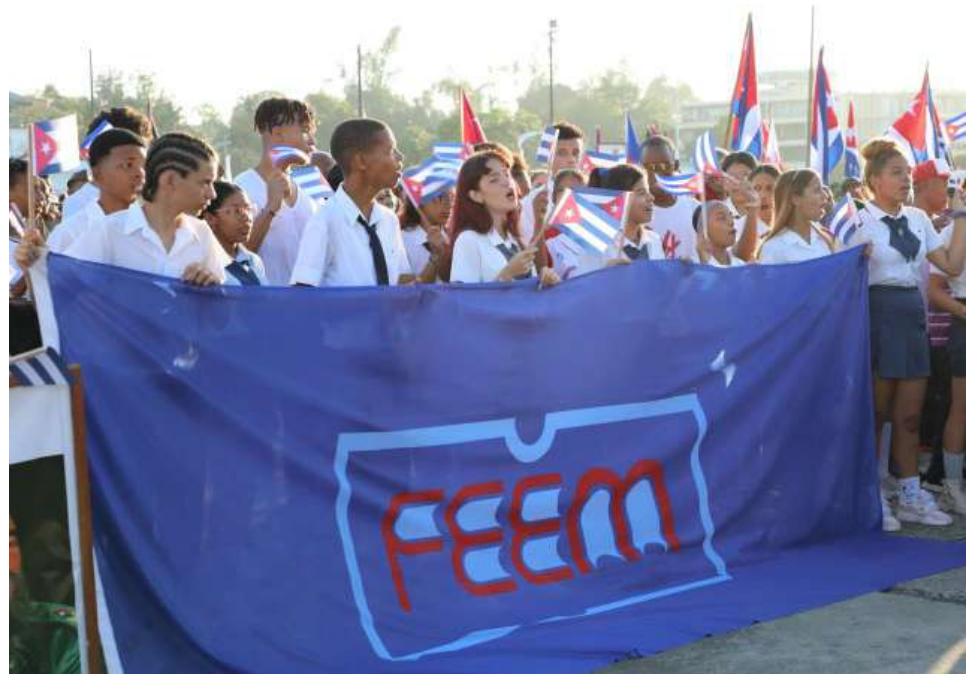
La Federación de Estudiantes de la Enseñanza Media también se hizo presente en la Tribuna.