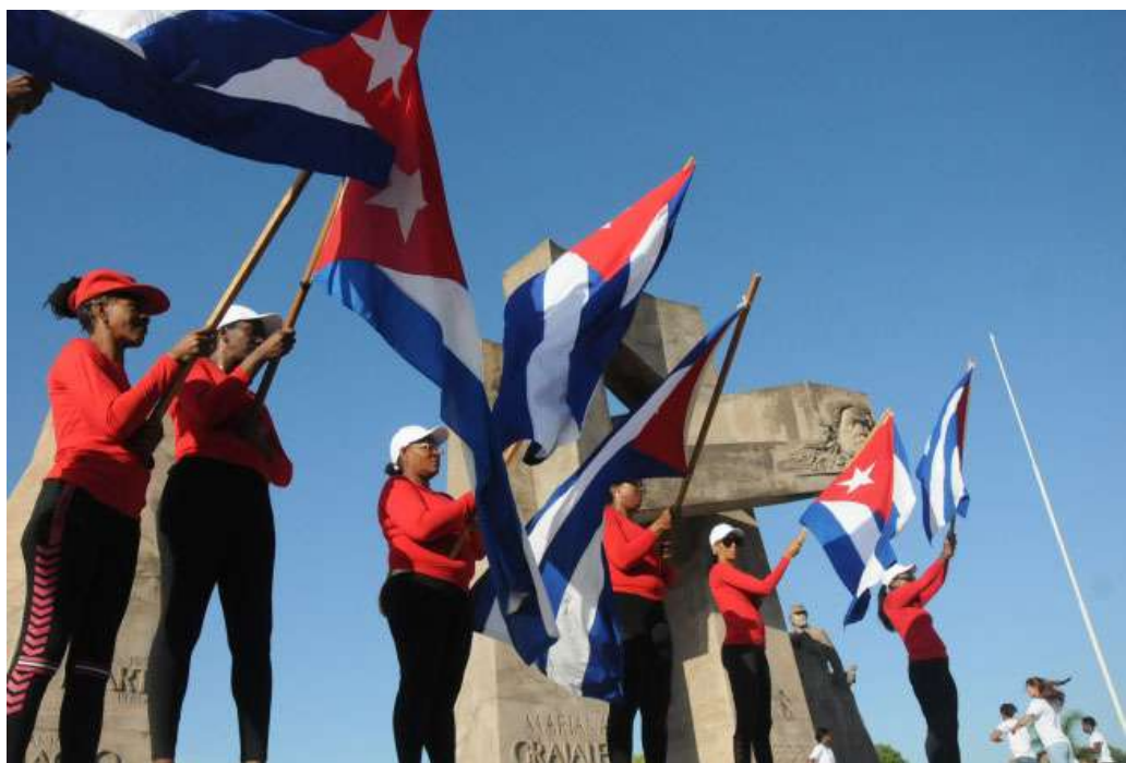
Las banderas cubanas ondearon alto una vez más.