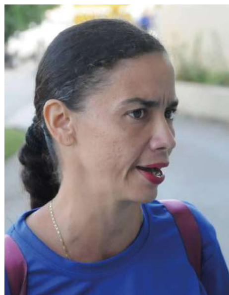
Fernández Castellanos: “La figura del líder de la Revolución Raúl CastroRuz es intachable”.

Patria y su soberanía, como líder revolucionario y ejemplo para las nuevas generaciones”, precisa.