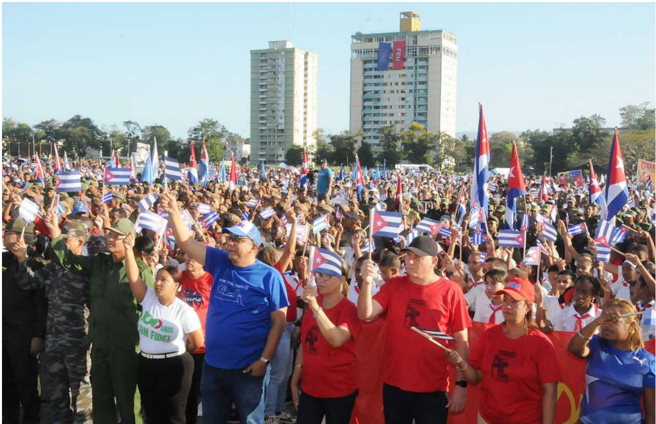
Miles de guantanameros, junto a sus dirigentes, asistieron a la Tribuna.